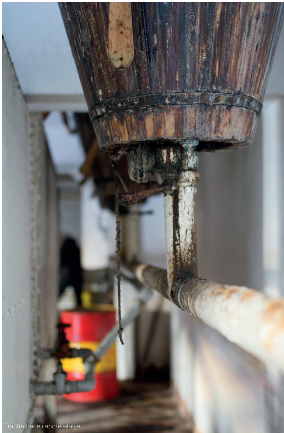
Trantraktene i andre etasje