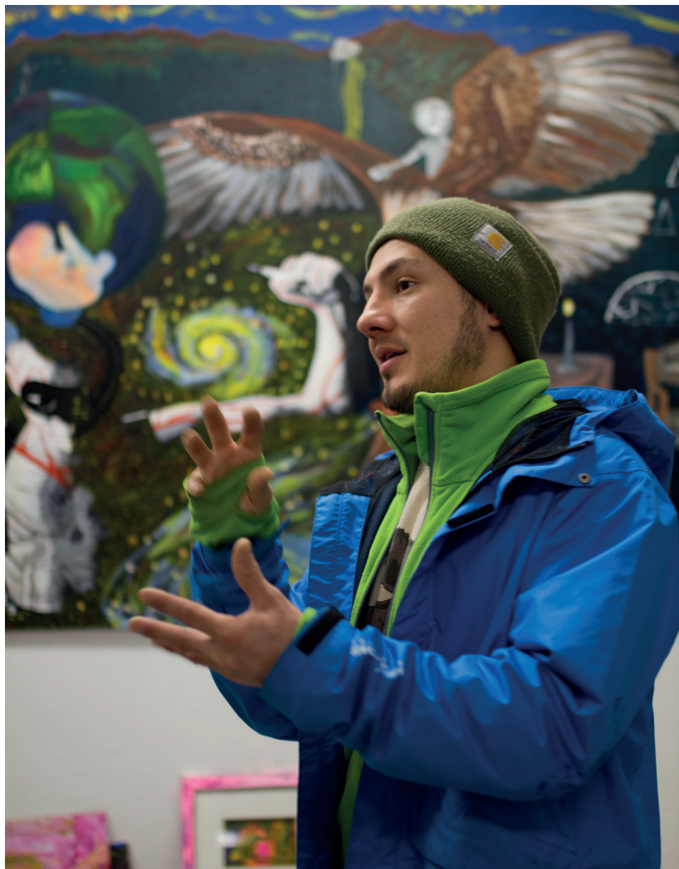
Solsoldat, lokal kunster i Kabelvåg.