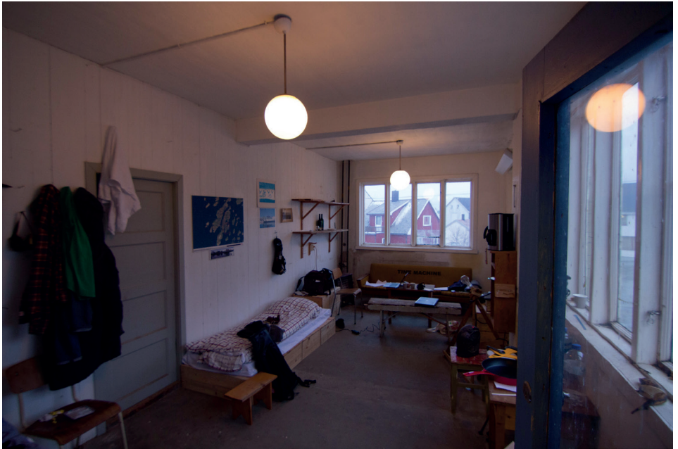
Varmeste rommet i bygget, nådde 15 grader. Andre etasje mot øst.