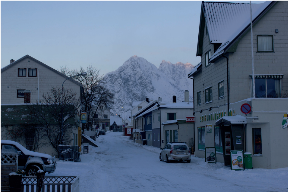
Vestvågstinden sett fra hovedgata