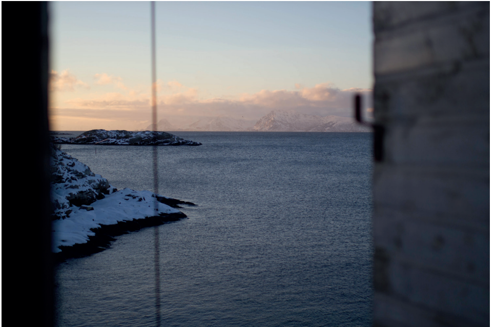
Fra andre etasje mot vest