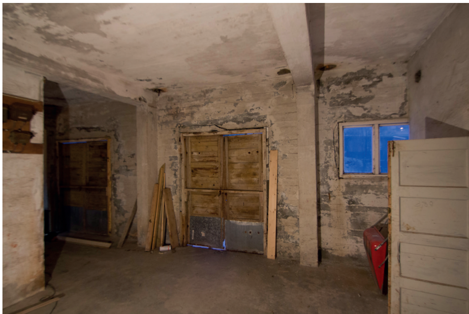
En av dørene i første etasje