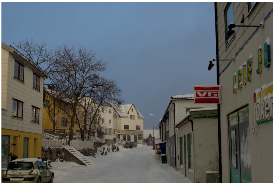
Hovedgata og Jokeren