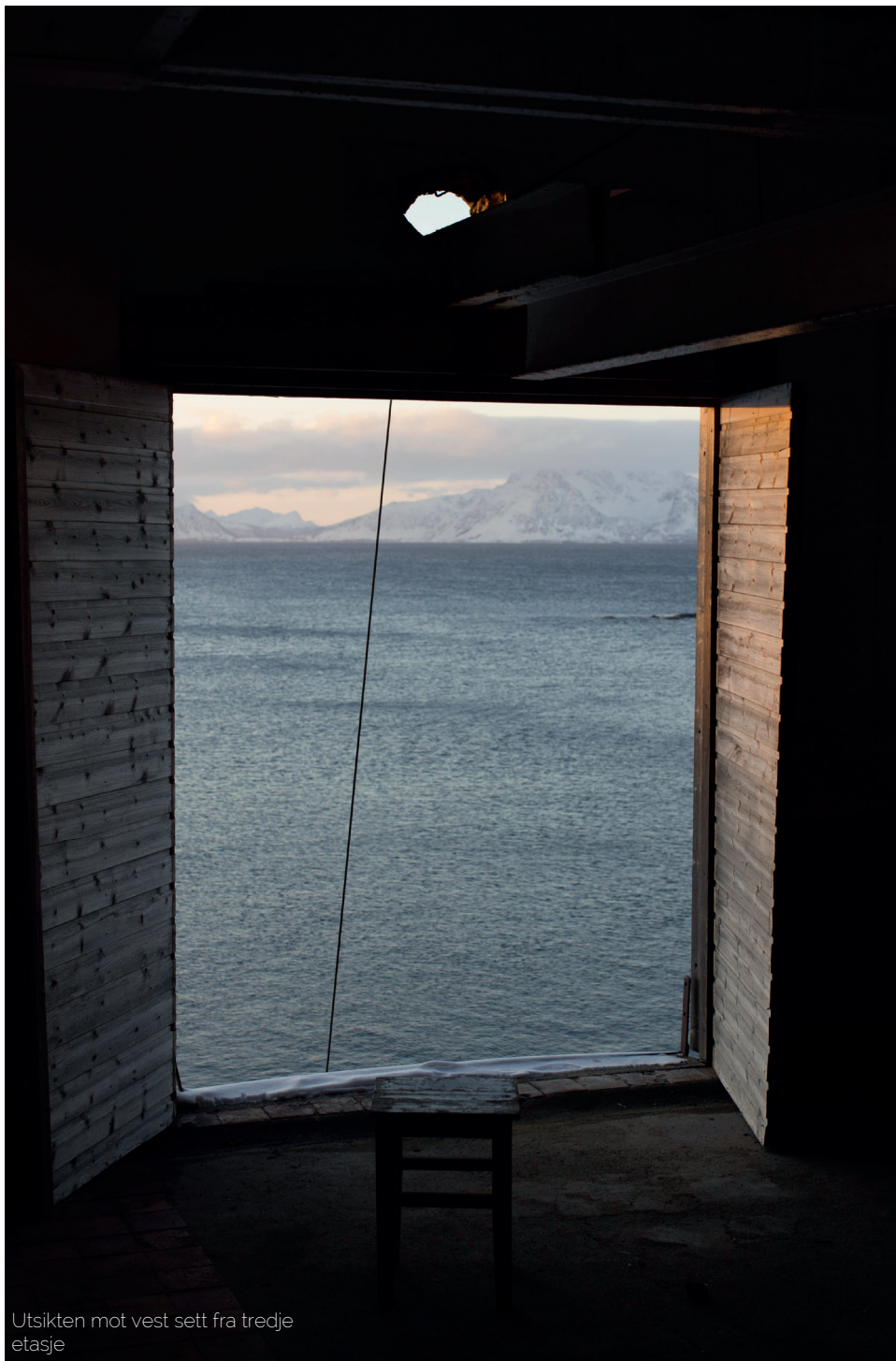
Utsikten mot vest sett fra tredje etasje