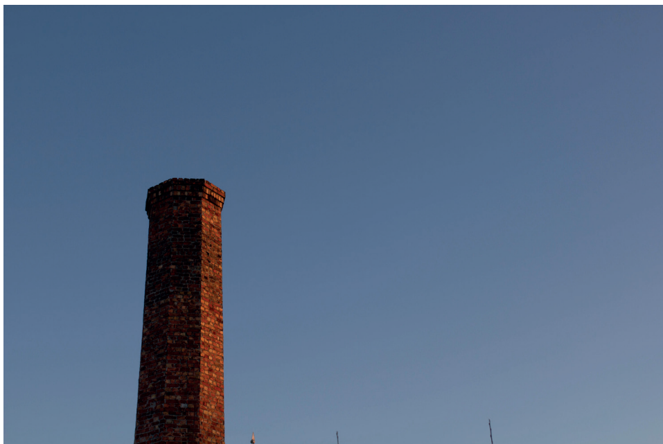
Skorstein i solnedgang