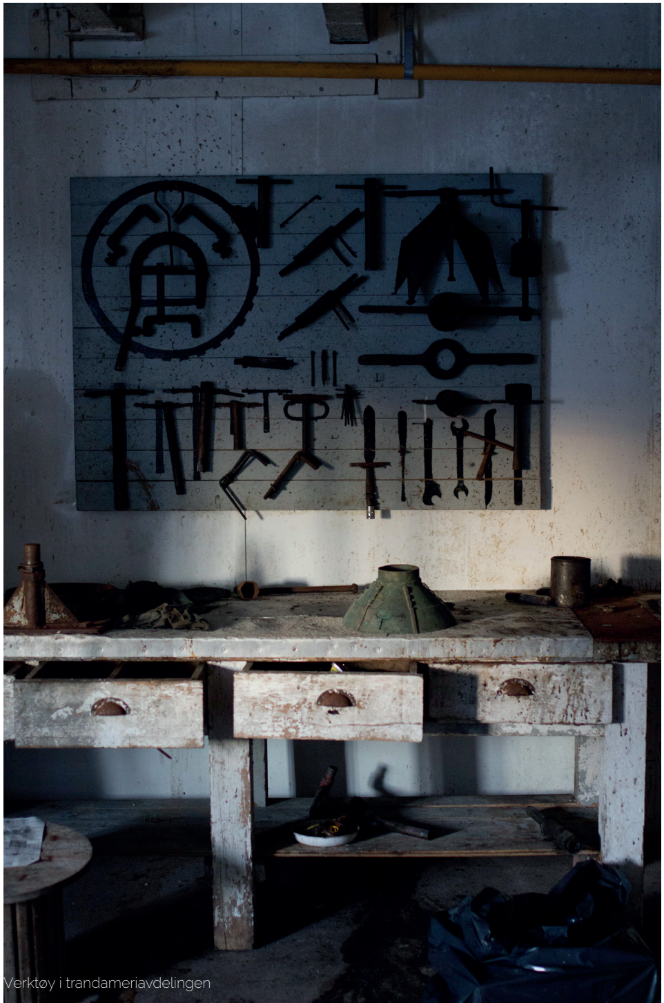
Verktøy i trandameriavdelingen