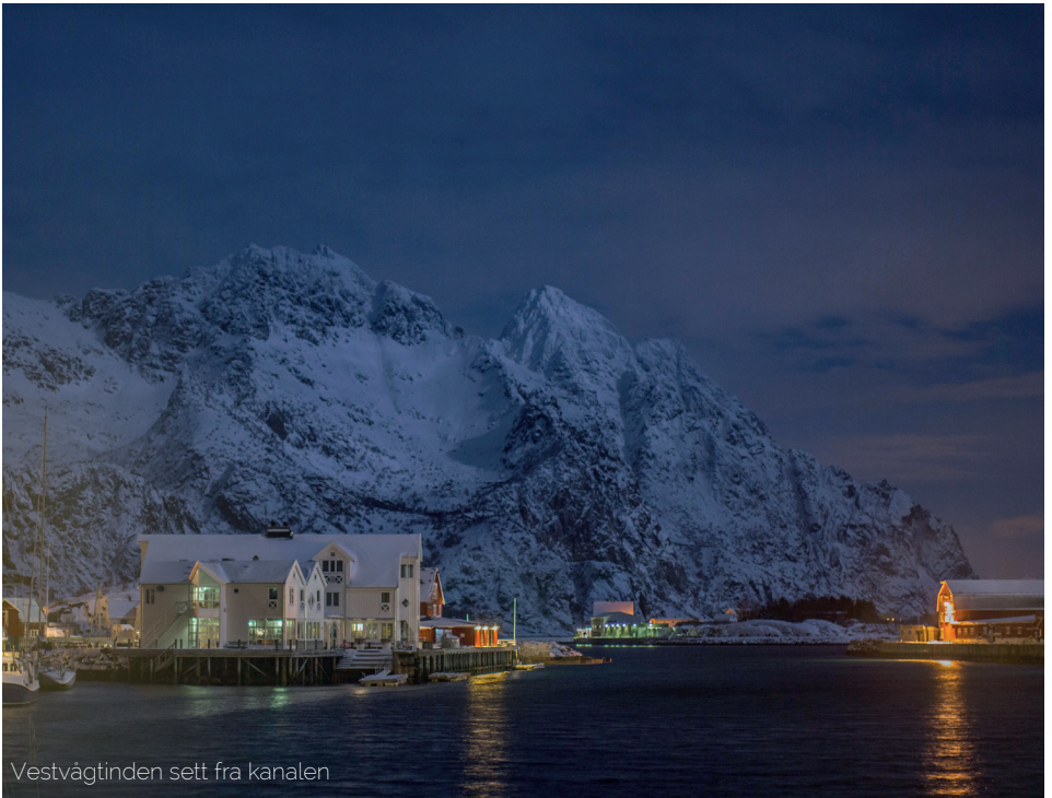
Vestvågstinden sett fra kanalen