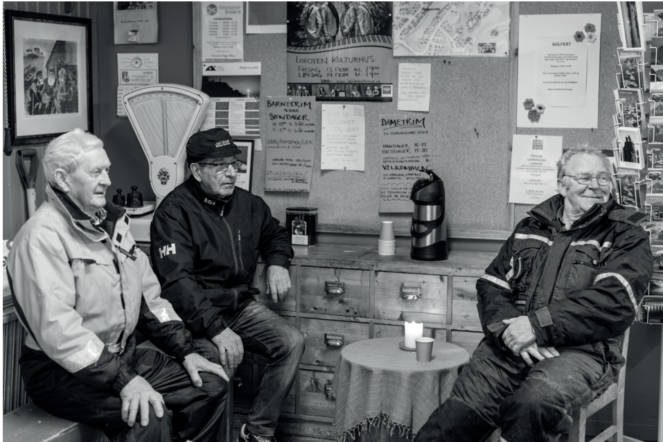
Livet på Joker.