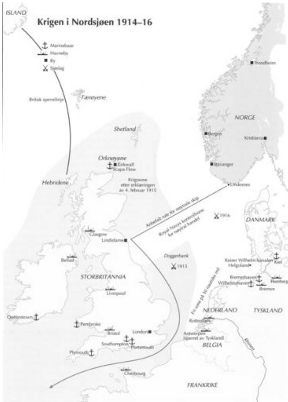
Illustrasjon fra Hobson og Kristiansen, Norsk Forsvarshistorie 3, 90