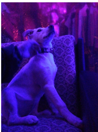
Figur 1: Valp på utested

Mitt valg av lokus for feltarbeid var litt tilfeldig. Jeg hadde aldri tidligere vært i Berlin, men kjente flere som snakket varmt om byen. Særlig hørte jeg mye om det "unge og trendy" miljøet i byen. Jeg hadde en forestilling om at jeg ville skrive noe som omhandlet relasjoner mennesker har til dyr, og overalt i Berlin skulle jeg finne tegn på at menneskene her hadde et bevisst forhold til de andre dyrene vi deler jorda med. På nesten ethvert gatehjørne lå en vegetarisk eller vegansk café. Ikke sjelden var jeg vitne til at PETA og liknende organisasjoner holdt demonstrasjoner på folksomme plasser i byen. Særlig ofte var det demonstrasjoner utenfor Zoo Berlin og byens akvarium. En annen ting man biter seg merke i når man er i Berlin, er alle hundene overalt. Omtrent annenhver person du møter på gata har med seg en hund, og de aller færreste av hundene går i bånd. I Berlin er hundehold veldig vanlig, og eiere må betale hundeskatt for hver hund de eier (Berlin 2015). Flere ganger møtte jeg hunder ute på byen om natten, like ofte på barer og nattklubber som på uteserveringer. En av mine første kvelder ute i Berlin, møtte jeg en dame med en labradorvalp på en nattklubb. "Of course she comes here with me. Should I just leave her home alone?!" var svaret jeg fikk da jeg stilte spørsmål ved det. I det svært urbane Berlin-livet er altså dyrene tilstede i høy grad, og er veldig synlige.