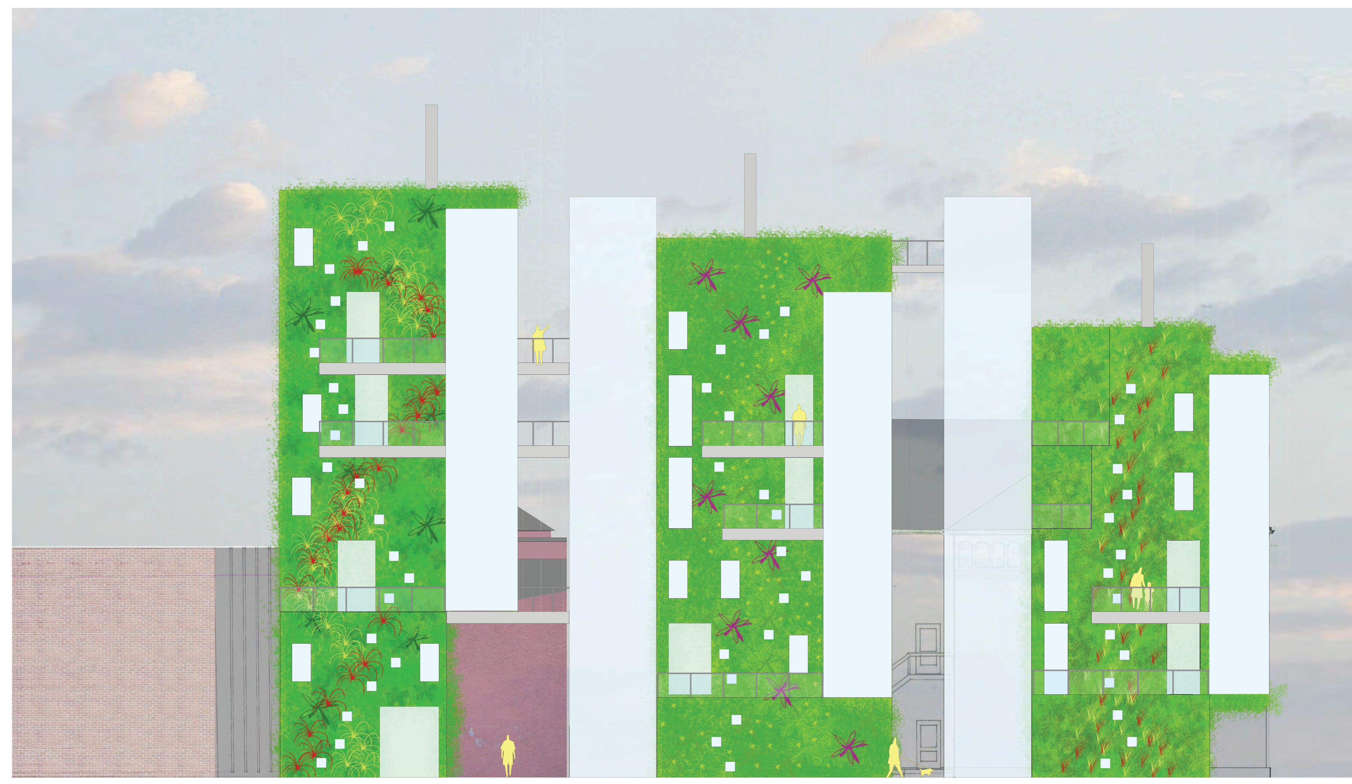
Fasade mot Heihen Landgrens gate (sør) 1:100