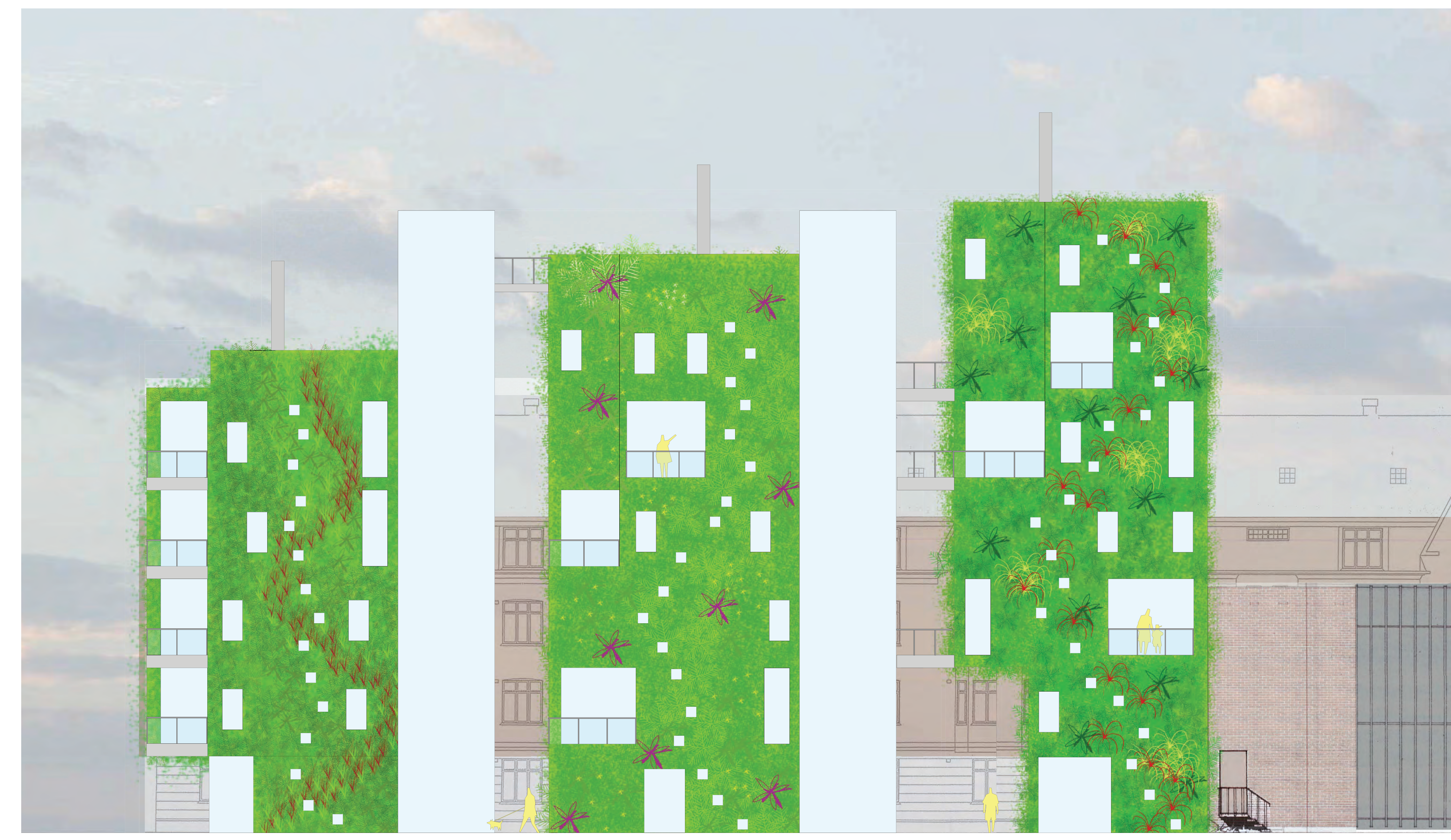
Fasade mot bakgårdsleier - nord 1:100