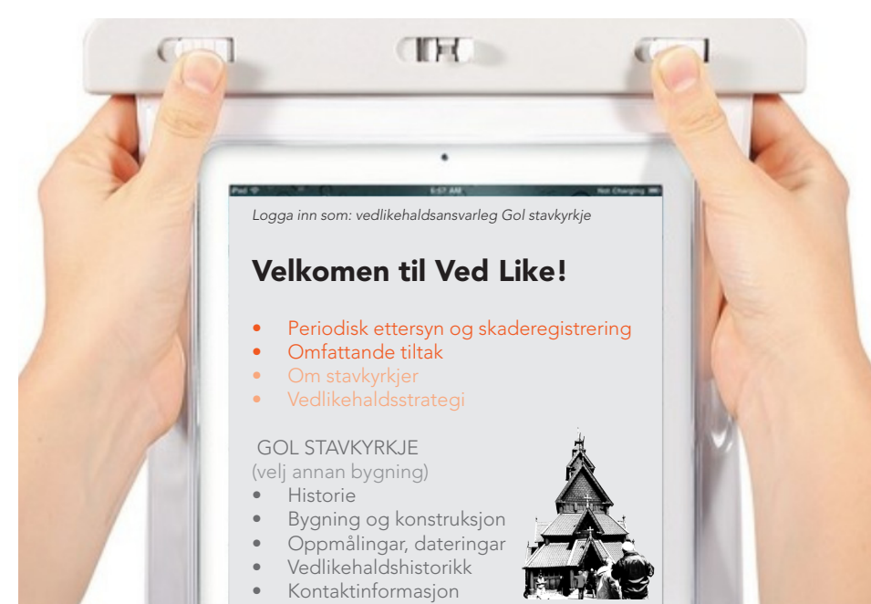
Slik kan den elektroniske utgåva sjå ut. For feltbruk er det praktisk å ha nettbrettet i vasssett lomme.

Ved Like kan utviklast med data for alle stavkyrkjene i Norge, knytt opp til ei sentral database. Slik kan ein enkelt samle informasjon for kvar stavkyrkje, og dele kunnskap på tvers av forvaltarane.