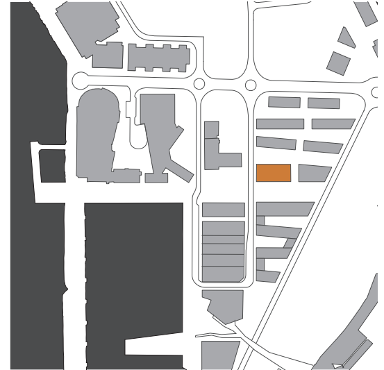
illustrasjon 10 tomtevalg