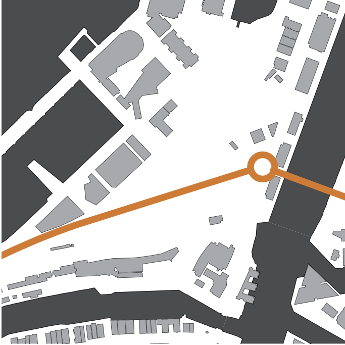
illustrasjon 3 ny trase for nordre avlastningsveg