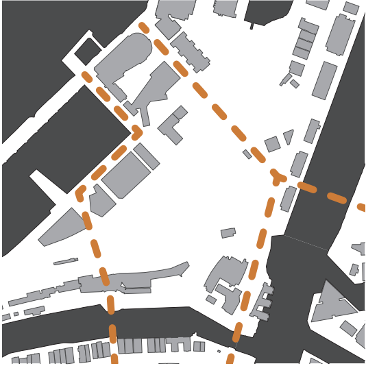
illustrasjon 7 gang- og sykkelvei