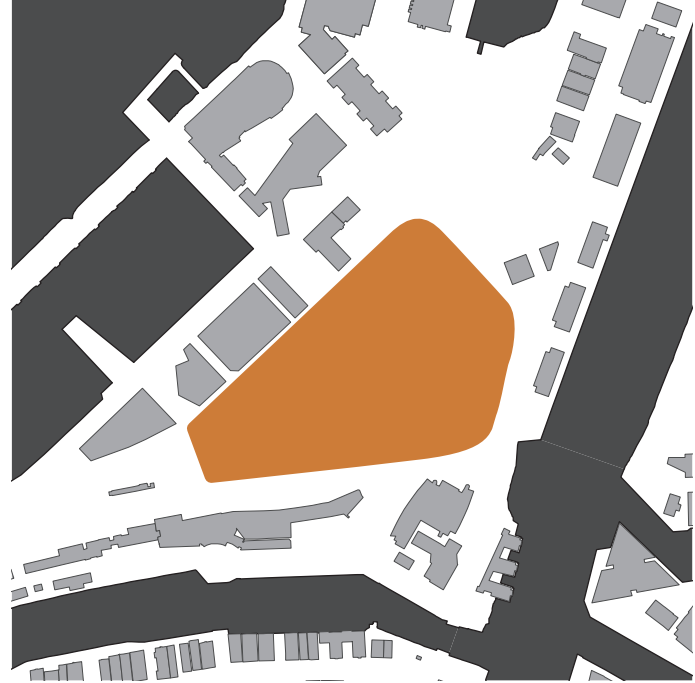
illustrasjon 4 godsterminalen