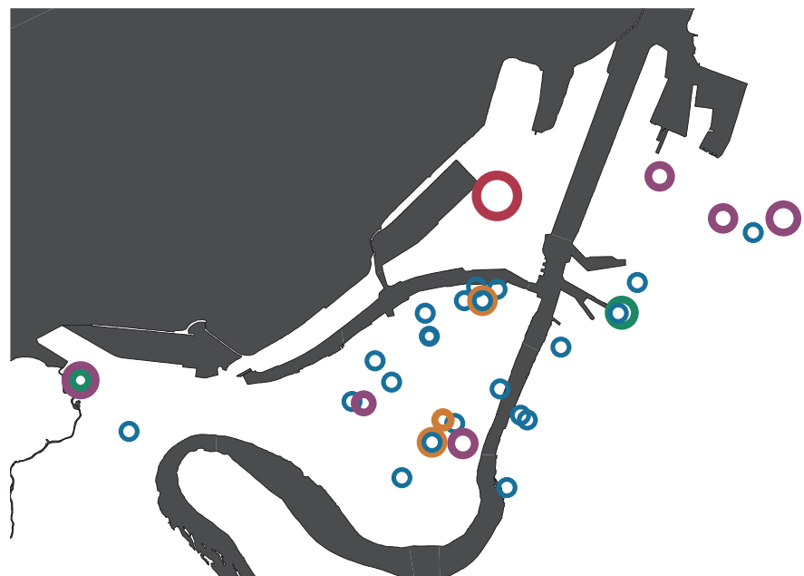
illustrasjon 2 kunstinstitusjoner