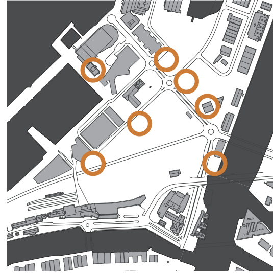
illustrasjon 8 tomtealternativ