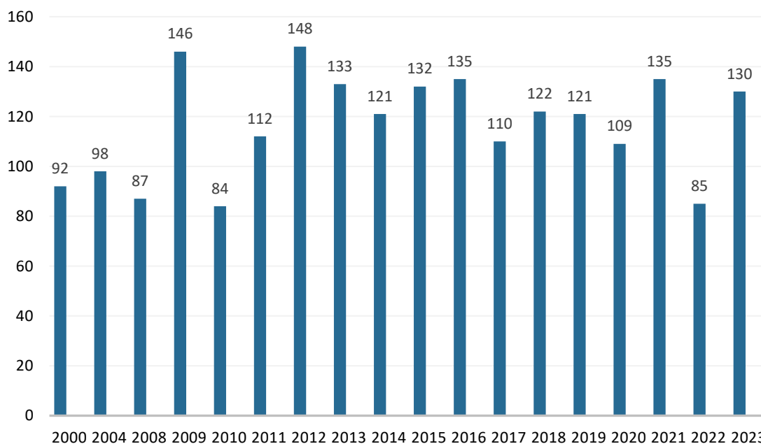
Figur 2: Udviklingen i antallet af top-8 point i OL-disciplinerne fra 2000-2023

Fra 2008 opgøres top-8 point også i de mellemolympiske år. For nærmere gennemgang af metoden henvises til Idans tidligere resultatanalyser på www.idan.dk . 7