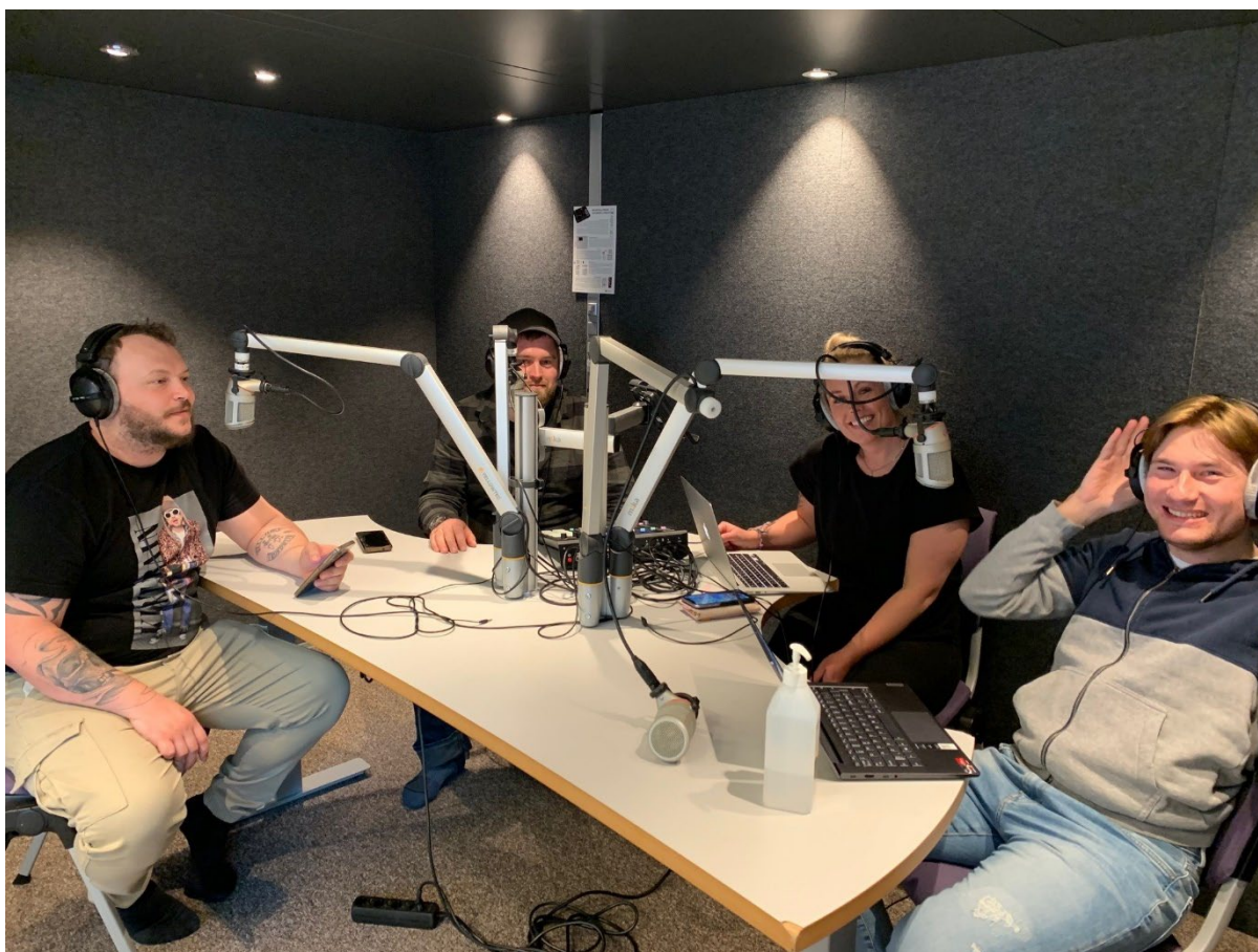
Bilde av yrkesfaglærerstudenter som spiller inn podkast, BLINK Læringshub, våren 22.

En læringsassistent fra BlinkLæringshub ble engasjert for å støtte studentene i podcast-produksjonen på campussamlingen i kurset. Hen hadde tilbudt å gi en felles innføring i Podcast Boksen 04.05 og 05.05, og var tilgjengelig i hele tidsrommet fra 08-16 på disse dagene. Hen ga innføringer i Podcast Boksen til de ulike gruppene og svarte på spørsmål som de måtte ha. Hen hadde også tilbudt å bistå med hjelp og eventuelle andre løsninger dersom det skulle oppstå noen tekniske problemer. Læringsassistenten var tilgjengelig for studentene hele tiden disse to dagene, og studentene var delt i grupper og fikk hver sine timeslots for produksjon.