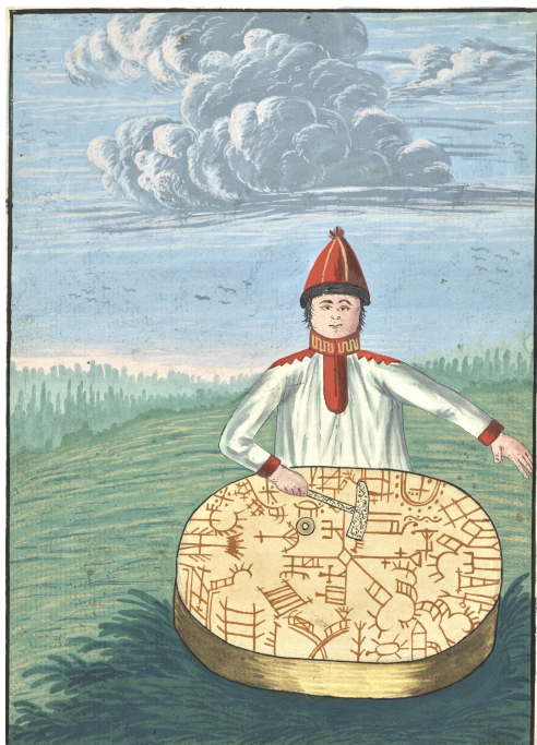
Leem, K. Illuminerede Tegninger til Kobberne i Leems Beskrivelse over Lapperne; med Forklaring