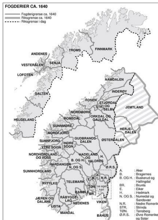
Figur 1 Oversikt over fogderiene i Norge ca. 1640. Hentet fra norsk historisk leksikon (1999), Imsen & Winge

Jeg kommer til å fokusere utelukkende på samene innenfor amtets grenser. Jeg skriver derfor om områder som var knyttet til fogderiene i Trondhjems amt på 1700-tallet. Disse var Fosens, Orke og Guldals, Strinde og Sælbo, Stør og Værdalens, Inderøens og Numedals fogderi. Disse grensene forble uendret i perioden jeg skriver om. Det vil si at områdene jeg inkluderer i de empiriske eksemplene er mulig å knytte til disse administrative enhetene, slik at andre deler av landet ikke blir en del av oppgaven. I figur 1 er det en oversikt over fogderiene i perioden jeg skriver om. I figur 2 er en oversikt over amtene i Norge.