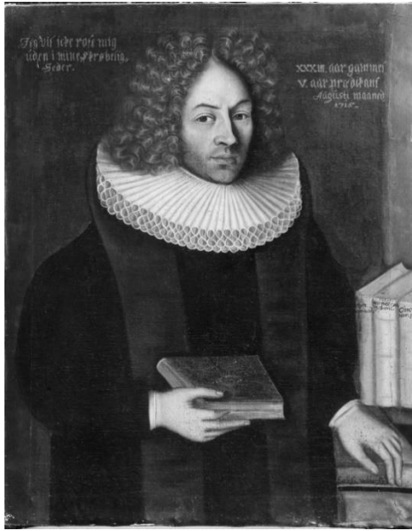
Figur 3 Portrett av Thomas von Westen. (1715) Ukjent kunstner. Hentet fra norsk portrettarkiv