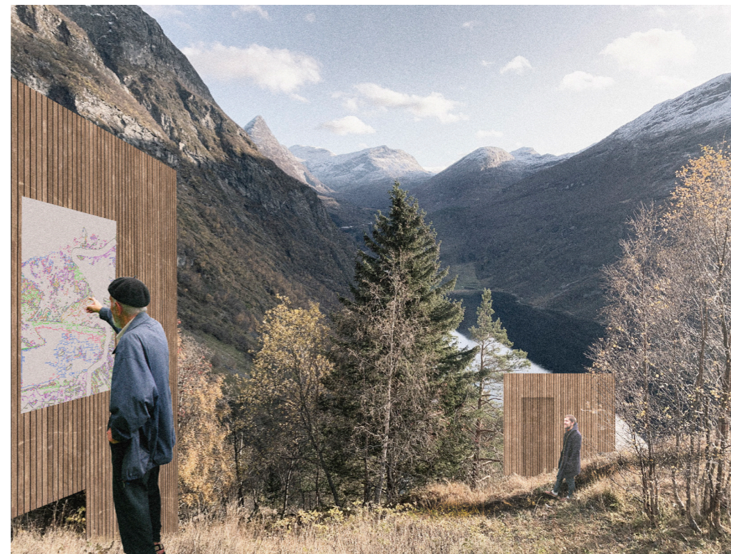
Illustrasjon fra tidlig i prosessen som viser hvordan besøkende kan oppleve samspillet mellom kunst, arkitektur og natur.

Et AiR-program kan bidra til å gi kompetanse og engasjement til å arrangere ulike eventer eller kanskje en festival som viser fram Geiranger, lokalsamfunnet og kulturlivet på stedet.