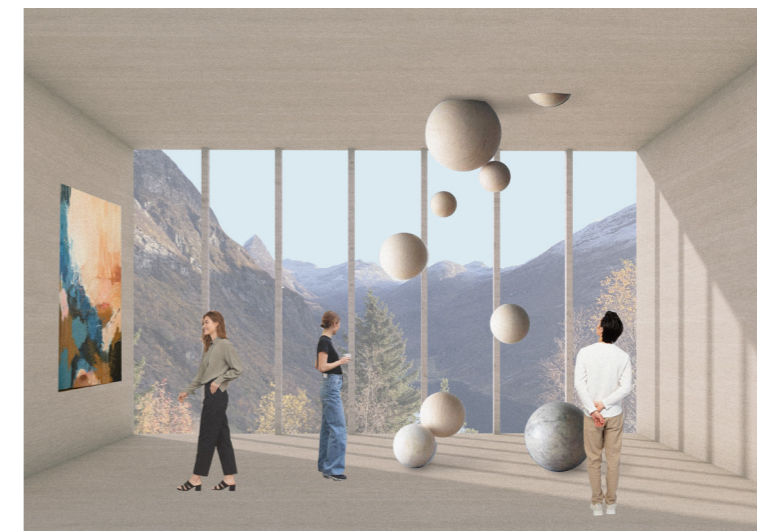
Illustrasjon fra tidlig i prosessen som viser hvordan et atelier kan brukes både til arbeid og utstilling.