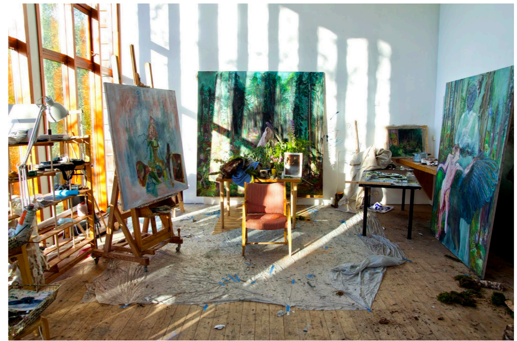
Dale Kunstnarsenter, Haga og Grov, Knut Hjeltnes. Kunstner: Paola Angelini (Eriksen, 2014)

I tillegg vil vi legge til rette for at anlegget kan gjøres om til et landskapshotell ved behov. Det å kunne leie ut boligene gjør programmet mer robust med tanke på at det blir mindre avhengig av offentlige midler, og kan finansiere deler av driften selv.