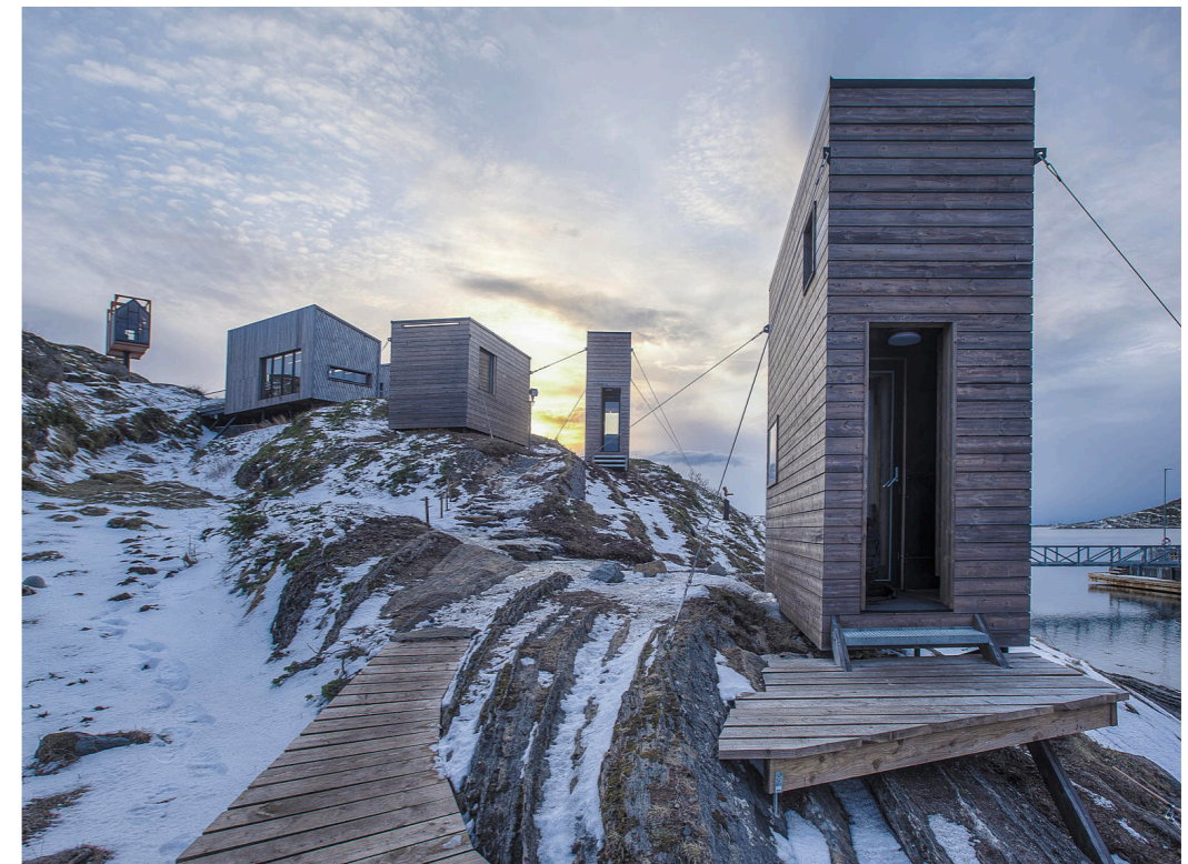
Fordypningsrommet Fleinvær, Tyin Tegnastue Arkitekter, Rintala Eggertson Arkitekter. Foto: Pasi Alto (Arkitektur N, 2017)

I dag eksisterer det ikke et nasjonalt program for Artist in Residence i Norge. Vi ser for oss at AiR-prosjektet i Geiranger kan samarbeide med andre, lignende prosjekter med spektakulær natur og arkitektur i Norge, for eksempel prosjektene på Trøna og Fleinvær, for å opprette et nasjonalt program som kan stille til rådighet investeringsmidler og faste driftsmidler til slike lokale programmer. Disse stedene kan i fellesskap markedsføre Norge som et spennende mål for internasjonale kunstnere og på den måten gi Norge gevinster i form av profilering av norsk natur, arkitektur, kunst og kultur. Dette kan også være positivt for distriktene som i dag ikke mottar like mye av kulturmidlene som de kanskje burde. Møre og Romsdal, og spesielt Indre Sunnmøre der Geiranger ligger får i dag svært lite kulturmidler, og et profilert AiR-prosjekt vil kunne bidra til å trekke flere ressurser til området.