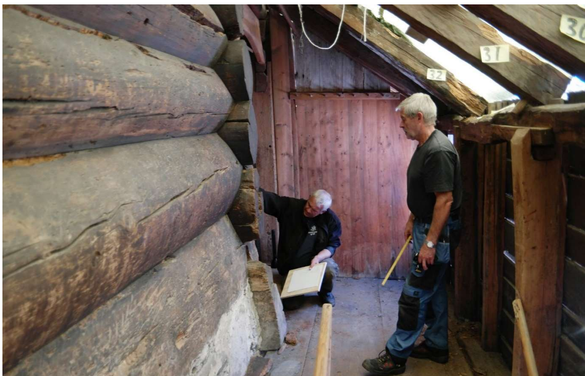
Fra Agatunet i Hardanger Og Voss Museum. Inspeksjon av laft.