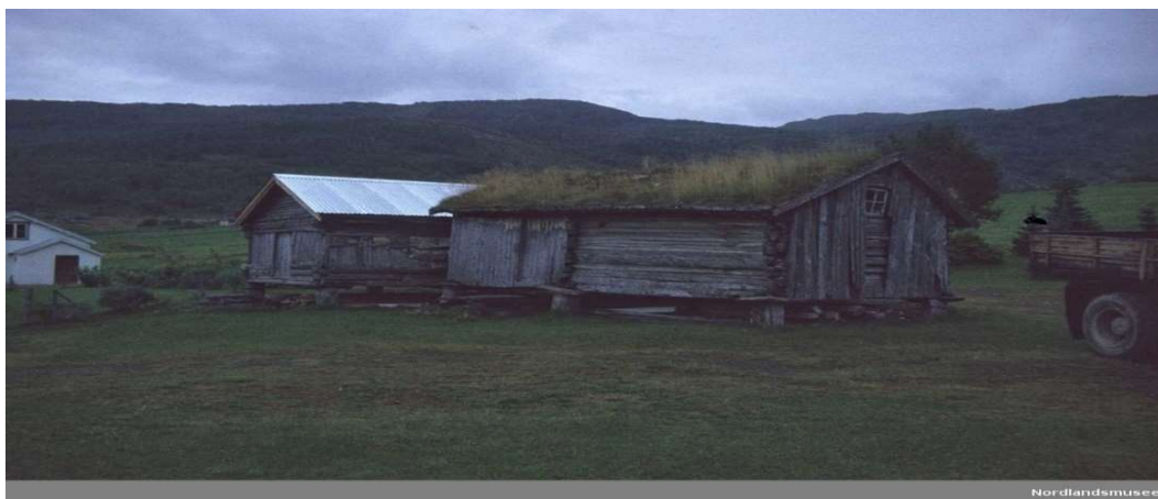
Torvtak og bølgeblekk. Førstnevnte er den eldre formen for tak

seg nødt til å skifte ut et torvtak med bølgeblekk på grunn av mangel på ressurser tilgjengelig. Dette blir da en drastisk form for restaurering. 15