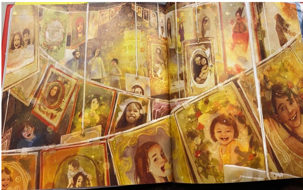
Figur 2: Mor, far og Augusta ser på bildene av Juni som Julian har hengt opp i stua. Dette blir romanens og gledesprosjektets vendepunkt.

Gjennom møtet med Hedvig og Henrik kommer Julian på ideen som konkretiserer gledesprosjektet og blir fortellingens vendepunkt. Siden Junis død har foreldrene unngått å snakke om henne, og sjeldent vært på besøk hos graven hennes. Julian bestemmer seg for å få familien til å huske den glade Juni, en idé møtet med Hedvig gir ham (Lunde & Aisato, 2018, s. 112). For å minne familien på dette får han hjelp av Henrik til å lage julekort med bilder av Juni på. Bildene viser hvor glad Juni var før hun ble syk: «På de aller fleste bildene smilte hun, eller til og med lo, akkurat slik hun så ofte hadde gjort. Det var bilder av Juni sånn som jeg husket henne» (Lunde & Aisato, 2018, s. 155). Når familien kommer hjem og ser bildene, forklarer Julian hva tanken bak er: