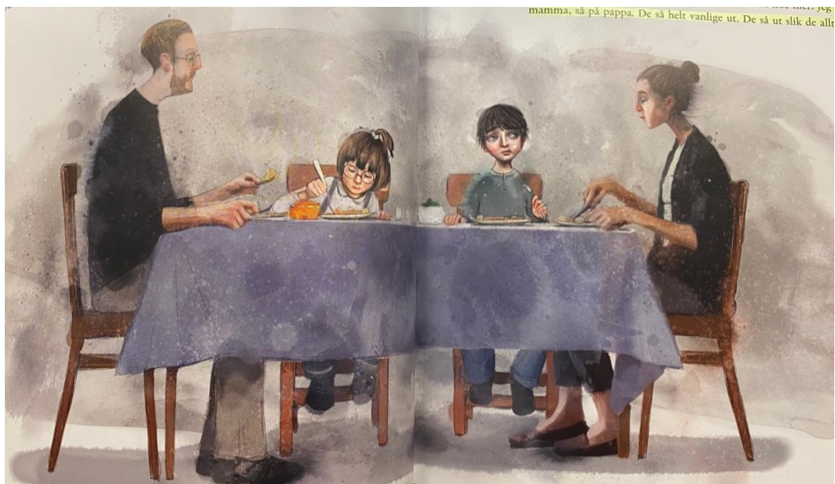
Figur 1: Illustrasjonen fra middagen synliggjør den sorgtunge stemningen som preger hjemmet etter storesøsterens død