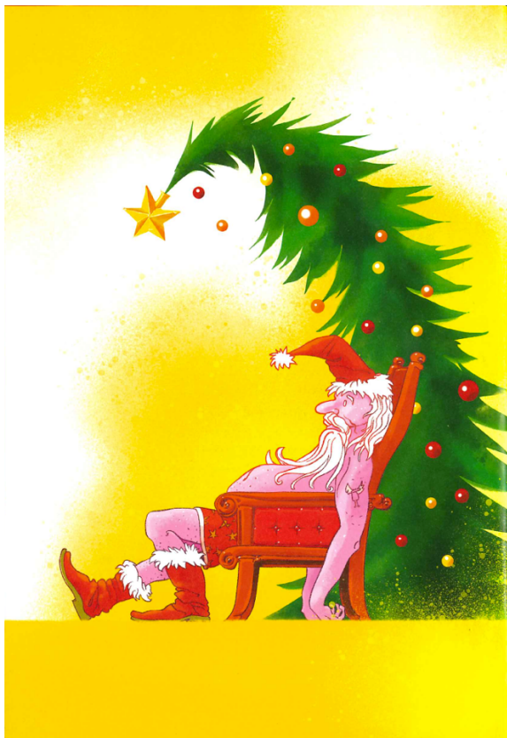
Figur 1: illustrasjon på side 4.

På bokens første side ser vi en illustrasjon av en svett og varm julenisse som sitter henslengt i en stol. Over han henger det et slapt juletre. Julenissen sitter kledd i bare underbukse og vintersko, og er åpenbart varm (Renberg, 2017, s. 4). Når vi leser verbalteksten forstår vi årsaken til at julenissen ser så varm og slapp ut: det er på grunn av det varme klimaet i nord i desember. Illustrasjonen skaper inkongruens, fordi i norsk sammenheng er julenissen og juletreet noe vi forbinder med nettopp julen, og deretter kulde, snø og vinter. Inkongruens bygger på at det oppstår et krasj med hvilke forventninger vi har (Cross, 2011, s. 7). Humoren oppstår i den visuelle situasjonen hvor julenissen befinner seg i et varmt klima, fordi vi ikke er vant til å se den kjente figuren i en slik setting. I tillegg gjør illustrasjonen at humoren blir visuell. Samtidig er det viktig å påpeke at kontekst er sentralt for om man oppfatter noe som humoristisk. For et barn fra Australia, hvor det er sommer og varmt når julen feires, vil ikke illustrasjonen nødvendigvis bryte med deres forventninger, men for barn på den nordlige halvkule kan det å se julenissen i et varmt klima være noe nytt og morsomt.