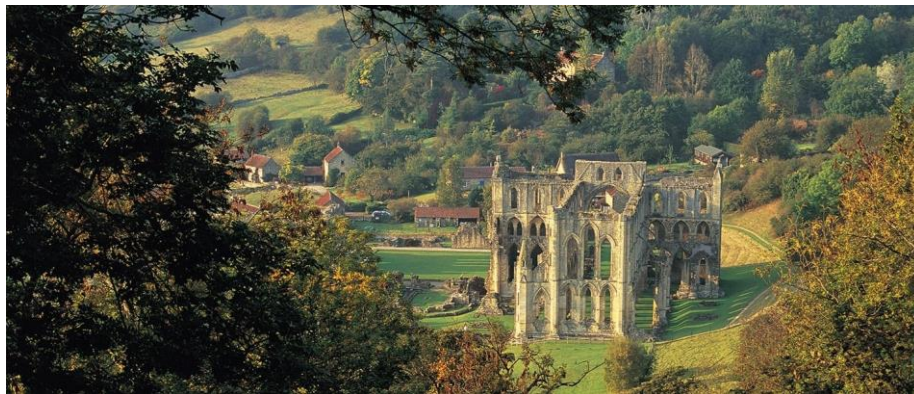
Fig. 2 – Rievaulx kloster i dag.

hvordan de organiserte og forvaltet andre områder de etablerte, om det så skulle være landskapene rundt lavlandene i dagens Belgia og Nederland, utbyggingen av kanaler i for eksempel Clairvaux eller Po i Italia, eller omgjøringen av skog til kultiverte jorder i eksempelvis Tyskland. Ved å skape miljøene rundt seg, og ikke minst forfatte dette ned til skrifter som følger ordenens liturgiske uniformitet, skapte de et asketisk og religiøst ideal hvor menneskets aktivitet bandt seg opp til Benedikts regel; deres ansvar for å utøve fysisk arbeid, hjelpe fattige og syke, og med den ansamlingen av eiendommer og den verdslige utfoldelsen som medfølger disse eiendommene binder cistercienserne eiendommen og naturen opp til samarbeidet med Gud og deres avhengighet av naturen. 113