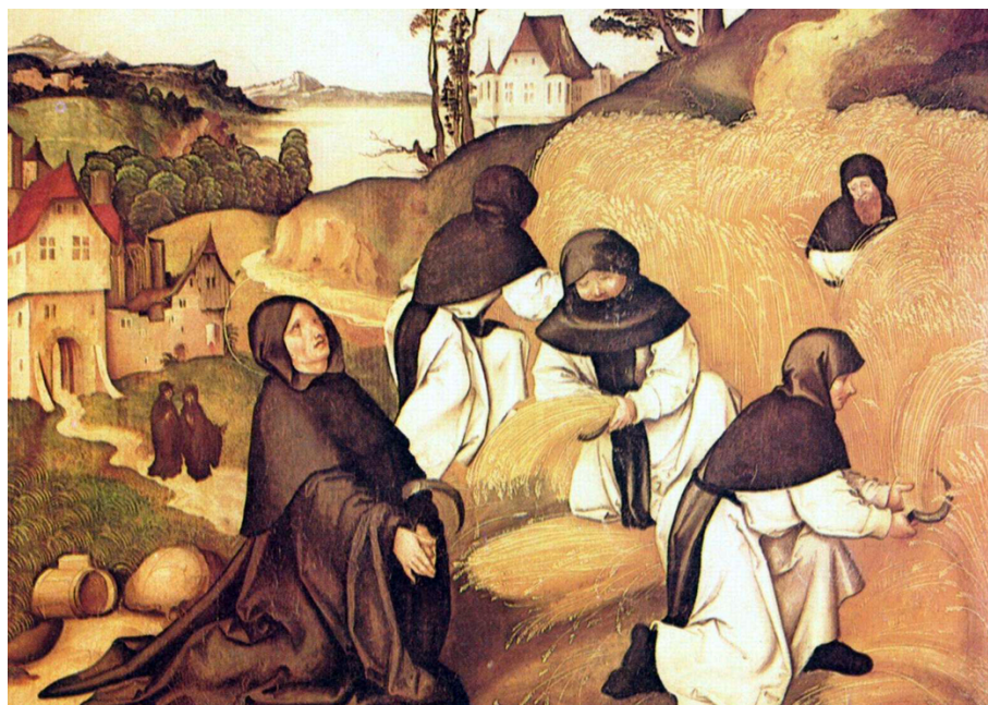
Scene fra livet til St. Bernard, malt av Jörg Breu (1475-1537)