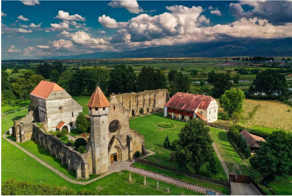
Fig. 3 – Cisterciansk kloster i Cârța, Romania. Illustrerer en idealistisk plassering av klosteret, med naturen umiddelbart rundt og fjellet i bakgrunnen som fungerer nærmest som en naturlig barriere.

I sentrum av klosteret, i flere aspekter, stod klosterets hage. Hagen var som nevnt en eksemplifisering av hvordan cistercienserne tidlig anså verden; det var et grønt område hvor det kunne vokse urter, frukt, grønnsaker og andre blomster, i ordnede former i dagslyset. 132 Hagen var som sådan en forestilling av verden cistercienserne forsøkte å kultivere, en plass hvor naturens kaotiske tilstand ble satt i en menneskelig orden for å høste inn godene. Urtene, med sin medisinske art og helbredende egenskaper, stod som eksempel på ordenens kunnskap samlet gjennom århundrene; frukten og grønnsakene som den elementære føden mennesket trengte. Dagslyset hagen trengte for overlevelse stod som kontrast til natten, og all den symbolikken denne kontrasten medfølger. 133 Med dette grøntområdet kunne cistercienserne nyte både sjelelige, religiøse opplevelser, men også benytte seg av de sosialpolitiske billedlige fruktene det medførte å ha grøntområder. 134