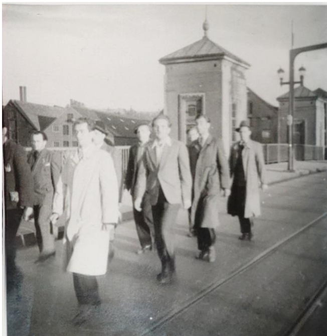
Bilde 12. Et av flere bilder brukt i undervisningsøkten.

Utforskende historie og kildekritisk bevissthet gjør fotografier til et godt virkemiddel for undervisning. Fotografier krever av sin natur nøye lesing og utforskning for godt utbytte, slik som denne oppgaven presenterer, og denne utforskningen er basert på god kildekritikk for å gi valide resultater. Det legger til rette for undring, refleksjon og vurdering av hvordan kunnskap blir til gjennom å gjennomføre egne undersøkelser og forme fortellinger - slik kjerneelementet sier. 136 En elev i den nevnte undervisningssituasjonen ga tilbakemelding på at man ikke får et ordentlig fasitsvar kun utifra bildene, så man blir usikker på om tolkningen stemte. En annen elev påpekte at ved å enten lese en bok eller se en film får man med seg det ene, men ikke det andre. Man trenger derfor et samspill av kildemateriale, og elevene ønsket mer kildemateriale for å “finne sannheten”. Videre sier kjerneelementet at elevene skal “kunne innhente, tolke og bruke historisk materiale som kilder i egne historiefremstillinger”. 137 Fotografiet i samspill med skriftlige kilder gjør dette mer tilgjengelig for elevene gjennom denne prosessen. Det må presiseres at bare å ta i bruk fotografier i en historietime er ikke tilstrekkelig for å oppfylle kravet i kjerneelementet. Læreren er nødt til å forme undervisningen og tilpasse det for elevene slik at læringsutbyttet blir optimalisert.