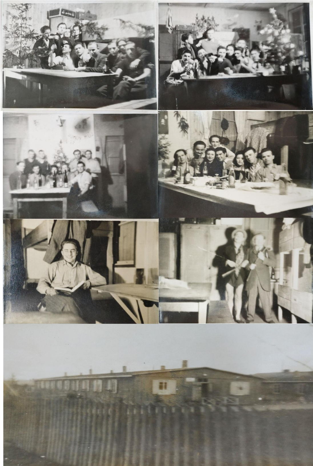
Bilde 5. Fotomontasje av brakkene