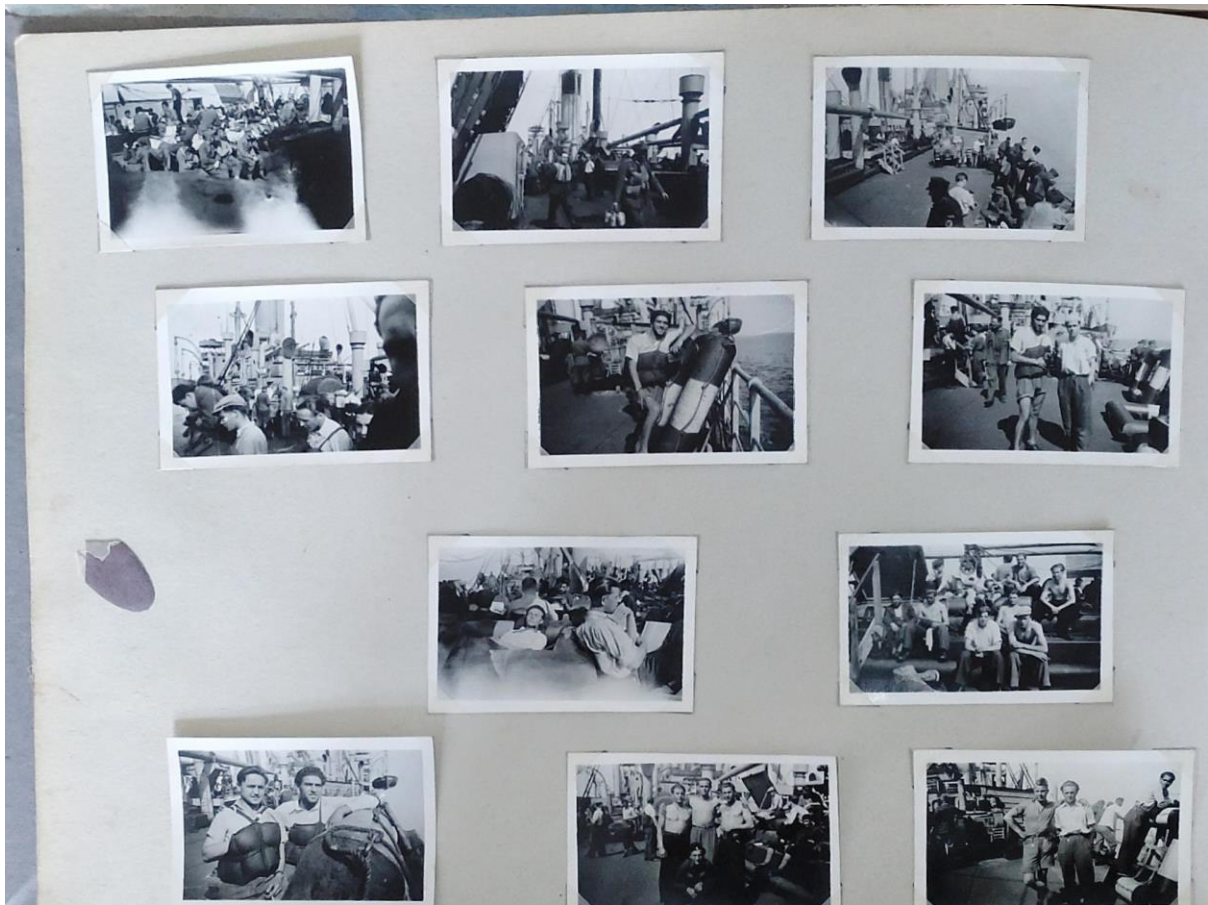
Bilde 9. En side fra et fotoalbum

Her er et bilde som skiller seg fra montasjen over ved at det er ikke er jeg som har satt sammen fotografiene. Vi vet ikke helt sikkert hvem som har gjort det, men en rimelig antakelse er at det er fotografen selv, Miroslav Marek, som har fått bildene fremkalt og limt inn fotografiene i fotoalbumet. Dette er side to i albumet, den første viser hav, skip og vannfly. En mindre detaljert formal analyse viser et bilde av en side i et fotoalbum hvor samtlige fotografier er tatt ombord et skip. Passasjerene er alle menn, og det er flere titalls av dem. Noen har livvest, men de fleste ikke. Noen poserer foran kamera enkeltvis, parvis eller gruppevis, men nesten halvparten er av passasjerene som bare gjør sitt. En leser et ark, kanskje et brev. En annen på samme bilde soler seg. De fleste sitter. Det første bildet viser det er mange mennesker på få plasser.