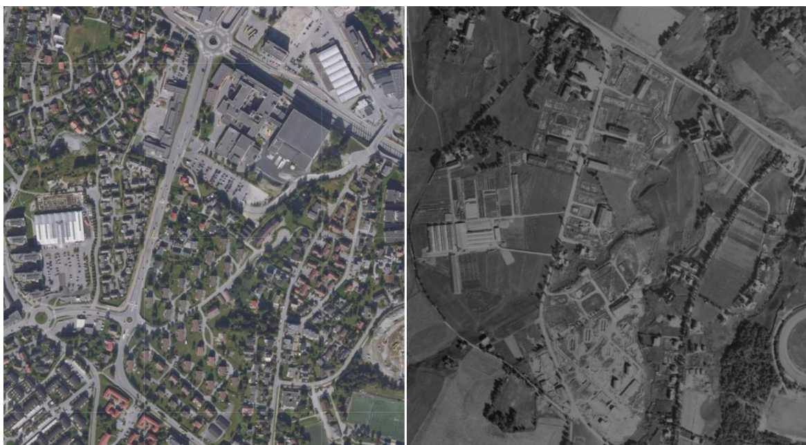
Flyfoto fra 2022 og 1947 sentrert på Bromstadveien i Trondheim. For lokalkjente er plantasjen til venstre, og krysset til nord er Strindheimskrysset med Nidar.