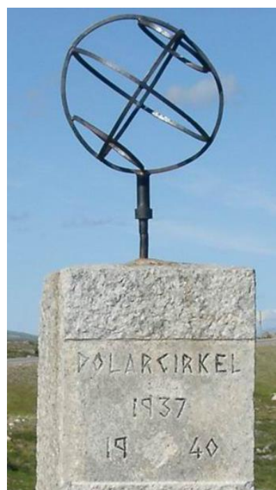
Bilde 7. Polarsirkelstøtten på Saltfjellet

Reisen til polarsirkelen i fotografiet viser at tsjekkerne var ivrige i å utforske landet i nord, og på tross av at de var plassert der i tvang forsøkte de å gjøre det beste ut av situasjonen. Hvis tsjekkerne hadde muligheten, det vil si nok fritid fra arbeid, gir fotosamlingen et inntrykk av at de reiste rundt i naturen og vekk fra byene de var utplassert i. At fotoapparatet var med på disse reisene var nesten en selvfølge, noe vi fortsatt merker i dag. En eldre reklametekst forteller at “En ferie uten et Kodakapparat blir en ferie uten minner”. 124 Antall fotografier fra reiser ut av byen og i naturen fra fotosamlingene reflekterer også dette, og tsjekkerne gir inntrykk i fotografiene at de var ivrige turister. Mengden med snø tyder på at det ikke er vinterstid, men samtidig ikke midtsommer. Muligens en tid på våren da snøen ser ut til å være i en smeltende fase. Man skal ikke undervurdere avstandene heller. Saltfjellet er ikke en ubetydelig distanse unna Narvik (over 30 mil), og reisemulighetene nå er ikke som da - spesielt under en okkupasjon.