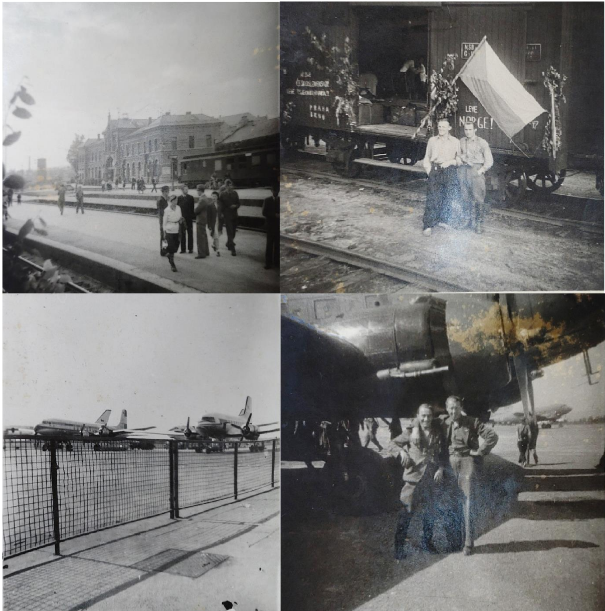
Bilde 11. Fire fotografier fra reisen sørover

Montasjen over viser fire bilder av og ved ulike fremkomstmidler: to av tog og skinner, og to av fly og flyplass. Det første bildet viser en togstasjon med et stort bygg i bakgrunnen, samt et mindre bygg til høyre for det igjen. Foran dette mindre bygget er en togvogn. På perrongen er det flere mennesker, som går enten alene, i par eller står i grupper. Helt til venstre i forgrunnen skimtes det blader av en busk. Det andre bildet viser to menn sentrert foran en togvogn i bakgrunnen, poserende arm i arm. Det ser ut som en togstasjon da det er flere parallelle togskinner på bildet. Togvognen bak er dekorert med det tsjekkoslaviske flagget, greiner, samt tekst som sier "Leve Norge!" og "Leve Tsjekkoslovakia", dog dette er noe mer utydlig. Det er en tekst over dette igjen som er uleselig, men det er skrevet på tsjekkisk da