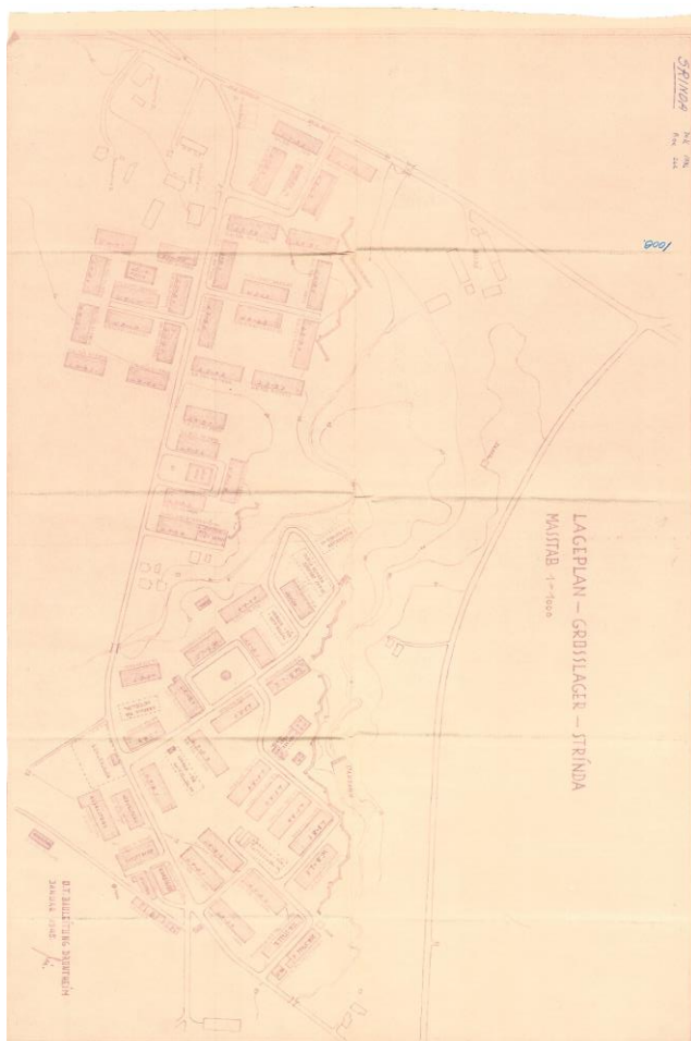
Plantegningene til Strinda arbeidsleir. Bromstadveien til venstre.