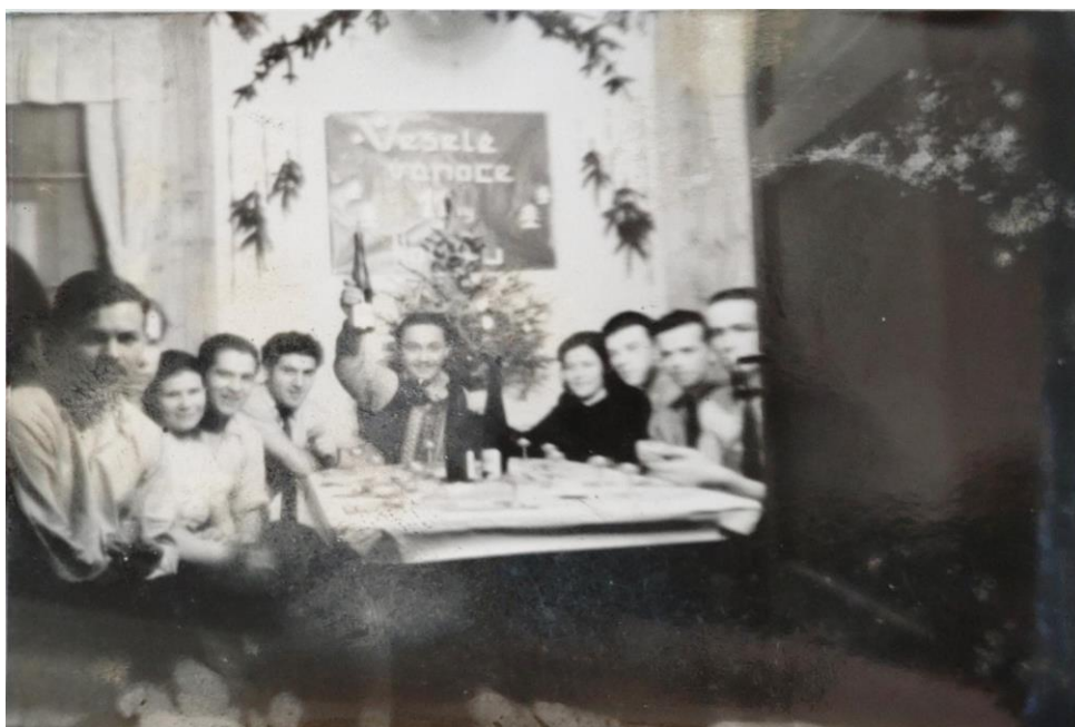
Bilde 3. Poserende venner på høytidsfeiring