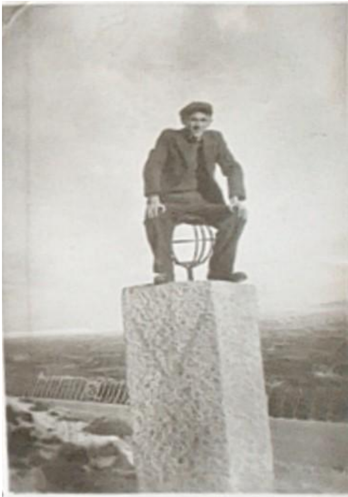
Bilde 6. Poserende tsjekker på et monument

Dette bildet, fra Ševčíks samling stasjonert i Narvik, viser en tsjekker som sitter på en støtte eller monument med en metallglobe festet på. Bakgrunnen er noe utydelig, men det ser ut som en vei som går gjennom et fjellet landskap, og at dette monumentet er plassert til side for veien. Det er noe snø i landskapet, men det er sporadisk. Tsjekkeren er kledd i hverdagslige klær, og poserer tydelig for et bilde. Monumentet over er mest sannsynlig Polarsirkelstøtta som er plassert på Saltfjellet. Fra vinkelen som er tatt kan man ikke se inskripsjonen, men hvis vi ser på et bilde fra i dag ser vi at det er to årstall: 1937, året som støtta ble reist, og