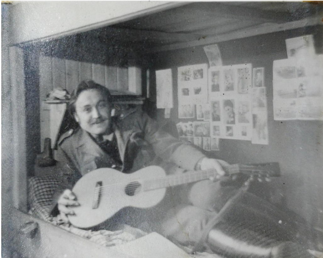
Bilde 2. Poserende tsjekker med gitar

Den formale beskrivelsen viser en ukjent tsjekkisk tvangsarbeider sentrert på bildet, og er tydelig hovedmotivet. Han ligger utstrakt i en køyeseng, oppstilt lent på hans albue for å posere for kameraet. På seg har han tilsynelatende formelle klær, muligens en uniform, samt høye støvler med buksene stappet ned. Han holder en gitar på en måte som viser den frem for kameraet. I sin sengealkove har han over putene en hylle til personlige gjenstander, og på vegg langs senga henger det flere (25-30) bilder og fotografier - tilsynelatende av flere kvinner.