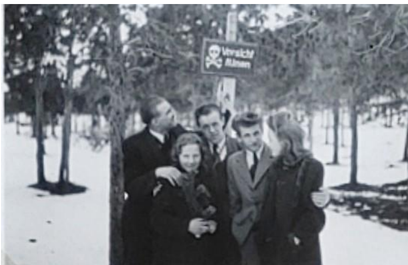
Bilde 8. Poserende tsjekkiske menn og norske kvinner

Dette bildet viser en gruppe mennesker, tre menn og to damer, som står poserende foran kameraet. Mennene holder på og rundt kvinnene i poseringen. De er kledd i fine sivilklær, men det er uvisst om dette er hverdagsklær eller noe bedre. I bakgrunnen er en glissen skog dekket av snø, og sentrert bak gruppen som poserer er et advarselsskilt med dødninghode og tysk advarsel - "Vorsicht" (forsiktig). Det står noe under dette også, men det er dessverre for utydelig for meg å lese.