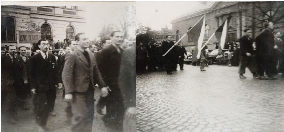
Bilde 10. To fotografier fra 17. Mai 1945

Disse to bildene er tatt fra 17. mai 1945. Det første bildet viser en stor menneskeflokk i for- og bakgrunnen. I forgrunnen ser vi menn som går i tog, pent kledd. Et skilt holdes oppe som