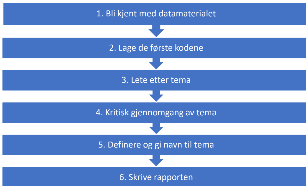
Figur 1: Modell for tematisk analyse

Braun og Clarke (2006, s. 87) har laget en modell for tematisk analyse som består av seks faser. Den kan illustreres på følgende måte: