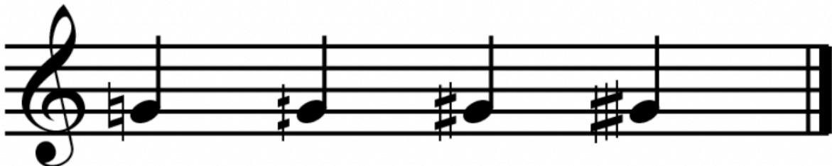
Figur 1: Mikrotonal notasjon (Rees, 2013).

I vestleg notasjon av mikrotonalitet er noko av det vanlegaste ein ser symbola for kvarttonar, som er dei mest brukte mikrotonale intervalla. Symbola er variantar av symbola ein bruker for kryss og b-er som vi kjenner godt, men med små justeringar som skil dei vekk frå dei vanlege intervalla vi bruker i 12TET.