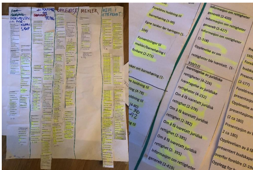
Figur 2 Sortering I tema

Med forskningssprsmålet i bakhodet samlet jeg data sammen til flgende overordnede tema; forkunnskap og forventning, rammer og tema, opplevelser, mekler, refleksjoner i etterkant. Videre skrev jeg ut kategorier og rent konkret limte disse temaene samlet under de fem overordnede temaene p en stor plakat.