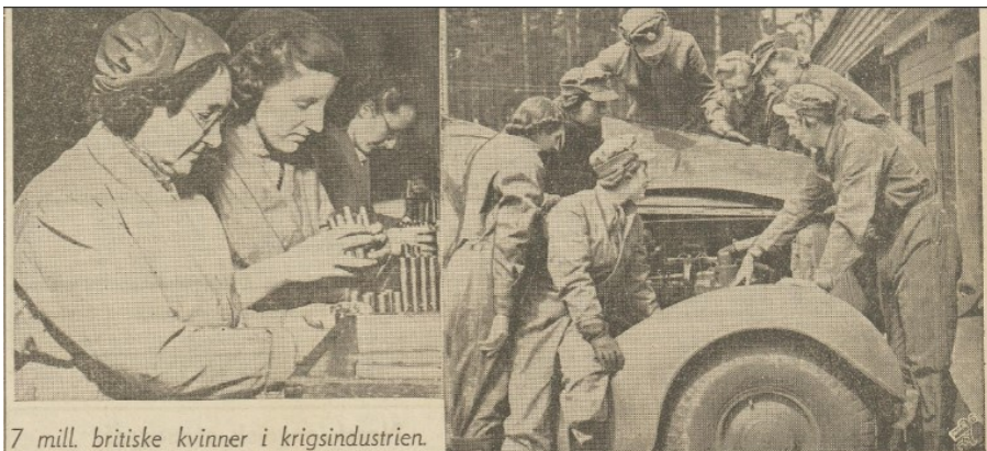
7 mill. britiske kvinner i krigsindustrien.

Et element som dukker opp i avisene i løpet av sommeren etter krigens slutt er bilder av soldater og beredskap fra utenfor Norge. Her får man plutselig se kvinner i en annen setting, f.eks. kvinner i arbeid med å bygge et hangarskip i USA og kvinner i arbeidsuniform i krigsindustrien i Storbritannia. Hvorfor virker det som at kvinner i slike posisjoner var mere akseptert der? Det var jo ikke slik at Norge var mye lengere etter disse landene når det kom til kvinnerollen før krigen. En årsak kan være at begge eksemplene er fra land som var frie under hele krigen, og dermed at en større andel av den mannlige befolkningen dro ut av landet for å kjempe. Som følge av det måtte kvinner ta ansvar for de normalt mer mannsdominerte yrkene enn det som kanskje var tilfelle i Norge. Her i landet kunne man delta i motstandskampen