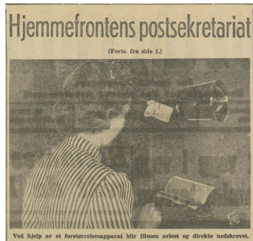
Bilde 3 Arbeiderbladet 16. mai 1945

I tillegg til at kvinner hadde erfaring fra slikt kontorarbeid, kan en annen grunn til at det var relativt mange kvinner i denne typen motstandsarbeid være de tradisjonelle kjønnsrollene,