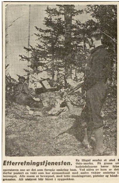
Etterretningsjenseten. En illegal sender et sted i Oslo-marka. På grunn av hottelefonene hører ikke operatøren noe av det som foregår omkring ham. Ved siden av ham er det derfor postert en vakt som har øyesamband med andre vakter omkring i terrenget. Alle menn er bevæpnet, med lette maskingevær, pistoler og håndgranater. Alt utstyret blir bæret i ryggsekken.