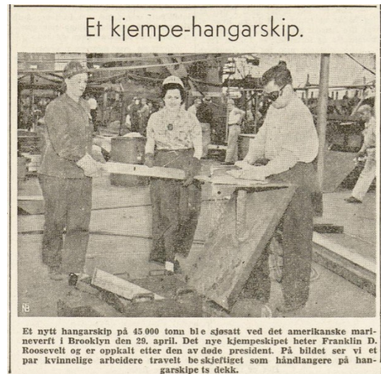
Bilde 12 Friheten 28. juni 1945