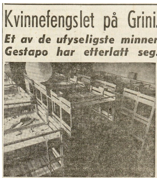
Bilde 4 Friheten, 25. mai 1945

Et bilde som er viktig for fortellingen om kvinner i disse avisene er faktisk et som ikke har noen personer med. Dette bildet har derfor alene ikke noen stor betydning, men i konteksten det er satt i er det ett av de bedre illustrasjonene av at kvinner gjorde en viktig innsats under krigen, og at innsatsen kunne få konsekvenser. Det er et bilde av en rekke fire-etasjers køyesenger stuet tett sammen i et relativt lite rom. Tittelen på innlegget er «Kvinnefengselet på Grini. Et av de ufyseligste minner Gestapo har etterlatt seg.» I teksten under påpekes det hvor forferdelig det måtte ha vært der