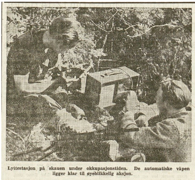
Lyttestasjon på skauen under okkupasjonstiden. De automatiske våpen ligger klar til øyeblikkelig aksjon.

Jonassens bok fra 2020 er det imidlertid flere bilder av kvinner som opererer radioapparater, så det eksisterte bilder selv om de ikke ble brukt i avisene.