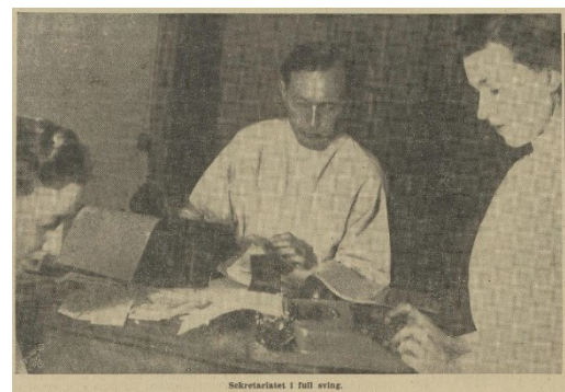
Bilde 2 Arbeiderbladet 16. mai 1945