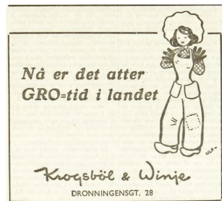
Bilde 8 Friheten 19.mai 1945

I noen aviser fra starten av krigen var reklame for husholdningsprodukter og mote en av hovedkategoriene der kvinner var representert i avisenes bilder. Denne reklamen viste tydelig hva samfunnet tenkte om kvinners interesseområder - det var hushold, omsorg og eget utseende. Slik reklame var også å finne i avisene fra månedene etter krigen, som denne analysen tar for seg. I denne sammenhengen kan det være interessant å nevne én spesifikk reklamerubrikk som var i noen av avisene der teksten er: «Nå er det GRO-tid i landet», med en illustrasjon av en kvinne i heldekkende arbeidsbukser. 75 Det er vanskelig å være helt sikker på hva rubrikken betyr, men elementer gjør at man kan undre om den har dobbel betydning. For det første er grotid skrevet oppdelt med gro i store bokstaver. Gro-komiteen var en gruppe kvinner på 12-14 stykker som fungerte som organisatorer for mye av aktiviteten til noen av kvinneorganisasjonene under krigen. Helga Stene var blant annet ett av medlemmene. 76 Kvinner i lange bukser var ikke vanlig i samtiden, og dette støtter tanken om at bildet kan vise til denne gruppen. Gjennom arbeidet de hadde under krigen hadde flere kvinner benyttet bukser av praktiske grunner. Begge disse