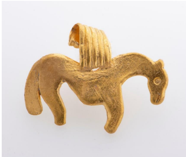
Figur 2: Et hengesmykke av gull (T26835).

oppgaven står en analyse av dette funnets fellestrekk i form av paralleller til andre funn og særtrekkene som viser til gjenstandens egenart og sjeldenhet (T26835, NTNU Vitenskapsmuseet).