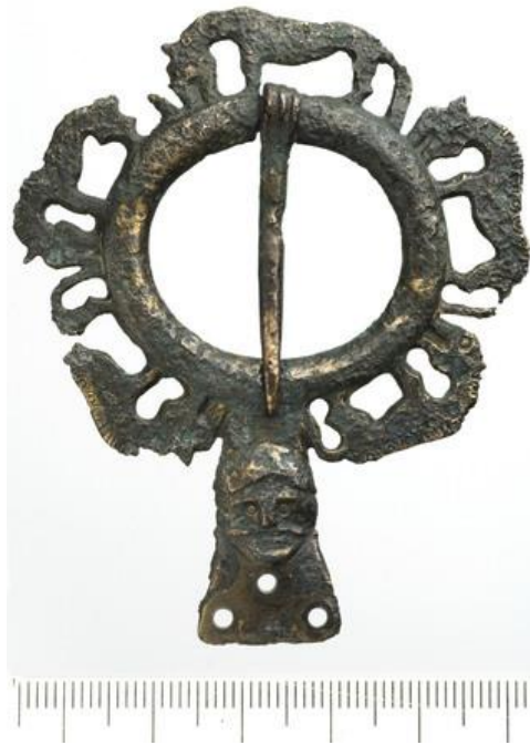
Figur 3: Spenne (T9826)