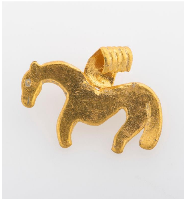
Figur 4: Et hengesmykke av gull (T26835).

personlig kommunikasjon, 10.april 2022) Jordbruksaktivitet i forbindelse med våronn og innhøsting utgjør et visst skadepotensialet rettet mot løse kulturminner som ligger øverst i pløyelaget (Fredriksen 2019, s.68) Hengesmykket har tydelige skrapemerker på begge sider, som kan skyldes en kombinasjon av landbruksaktivitet og naturlig slitasje som følge av miljøet den har oppholdt seg i (se figur 4). Men at skjæret på ploegen skulle kunne skade hempen på et lite hengesmykke, som dessuten veier bare et gram, virker ganske usannsynlig. Pløying og annen jordbruksaktivitet vil trolig bare flytte på og skyve vekk en så lett og liten gjenstand.