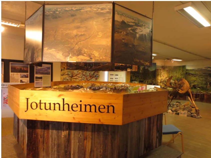
Fra utstillinga «Jotunheimen».