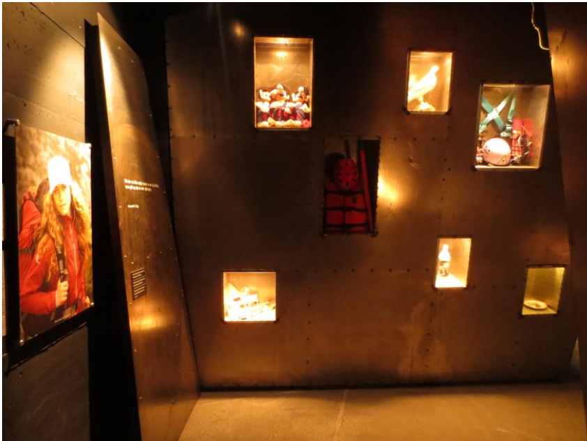
Nyere friluftsliv representert gjennom gjenstander.