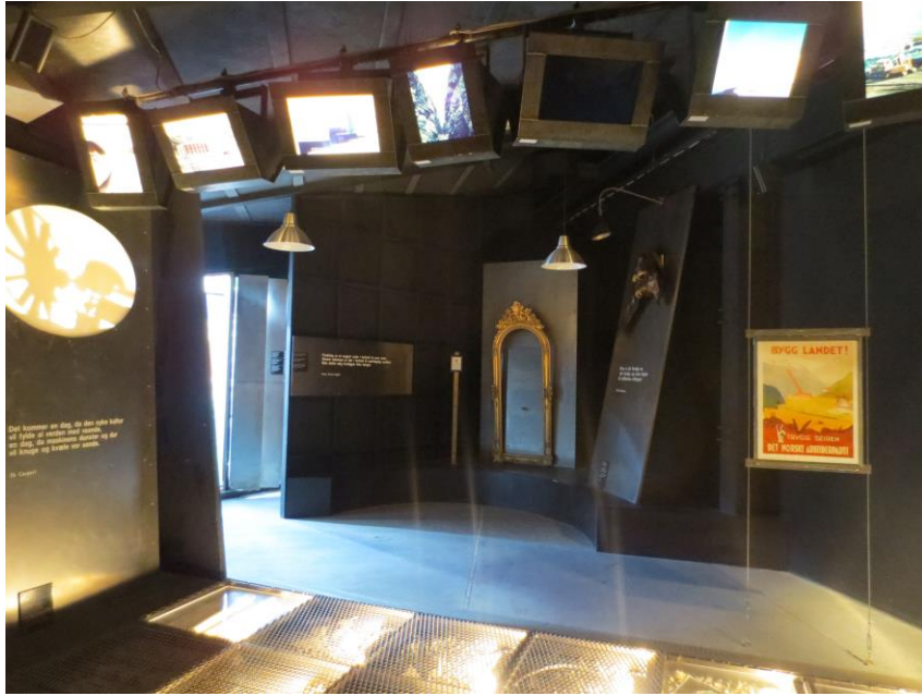
Trusler mot naturen fortalt gjennom lyd, lys og bilder.