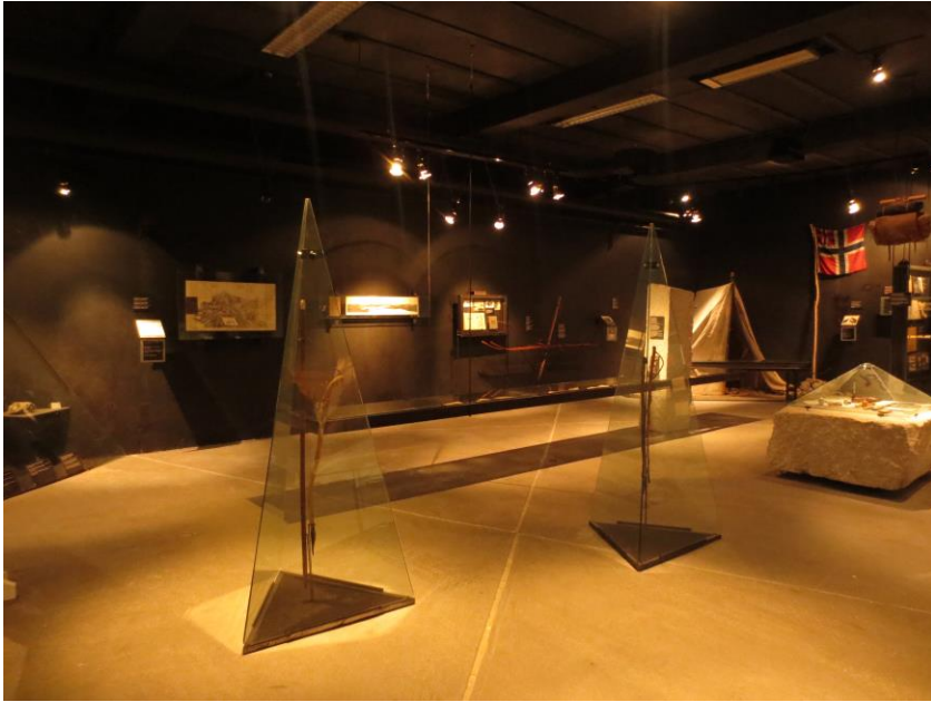
Del av utstillingsarealet, med fokus på fjellturisme.