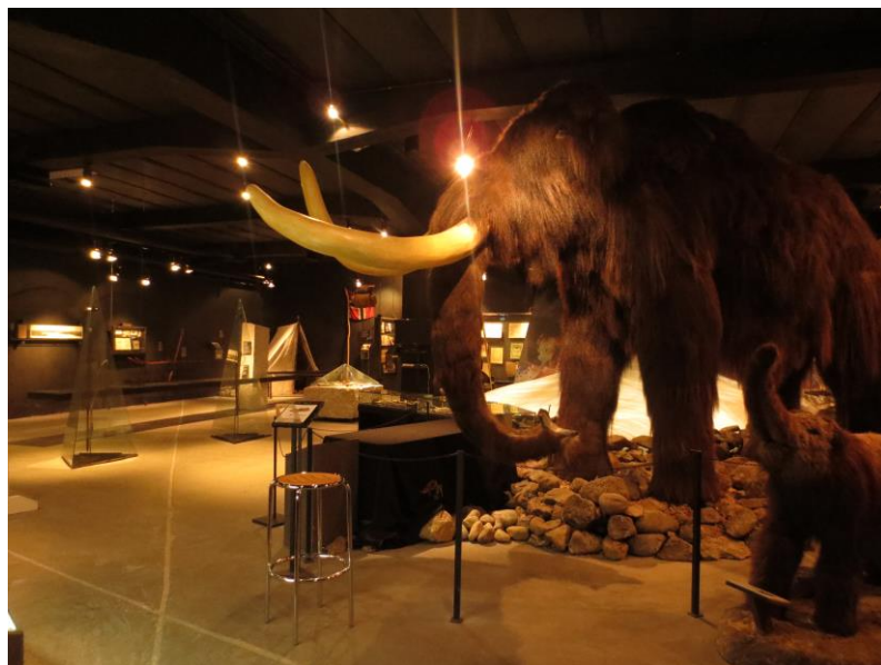
Første møte med utstillinga er en mammut i full størrelse, med sitt barn.

Mammutfunnene blir til en viss grad forklart med enkle tekster. Opplysningene tar hovedsakelig for seg funnkontekst. Funnene er lokale, men settes inn i en nasjonal kontekst. Både barn og voksne må sies å være målgruppe, men vil nok være til ekstra stor fascinasjon for barn. Temaet gir mest inntrykk av å spille på opplevelsen. I tillegg kommer kunnskapen om at slike funn har blitt gjort.