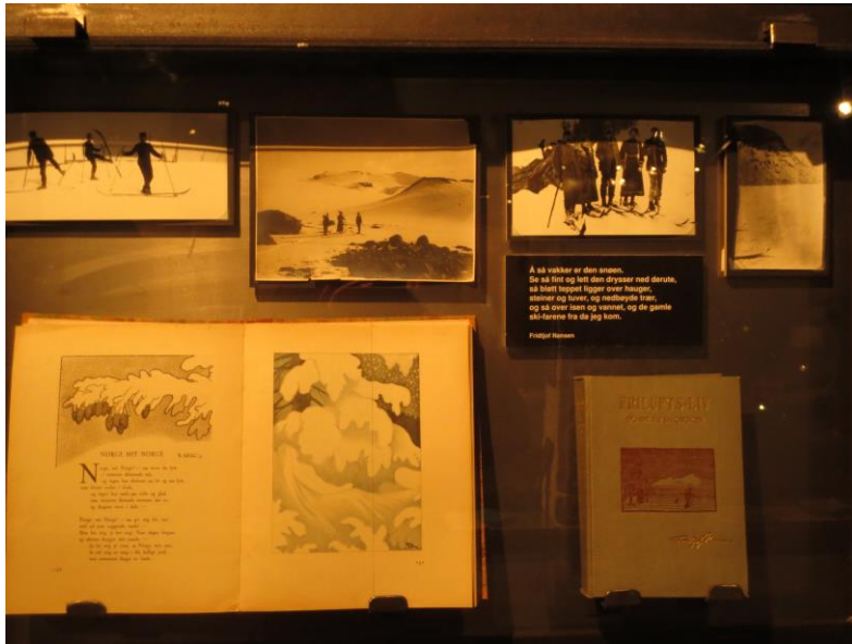
Nasjonalromantisk framstilling i bilder og ord.