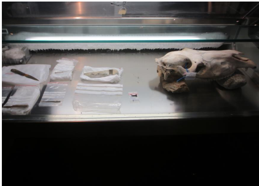
Nye funn fra sommeren og høsten 2014 – nærmest direkte fra funnssted til «ferskvaredisk» i utstillinga.