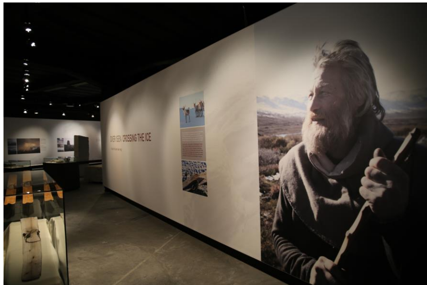
Fra utstillinga. Bildet er tatt like før åpning.

Utstillinga har fått navnet Over isen - funn frå isen viser veg . Samme lokale brukes som «Norske høgfjell», men det er noe redusert. Utstillinga har offisiell åpning den 17. mai 2015.