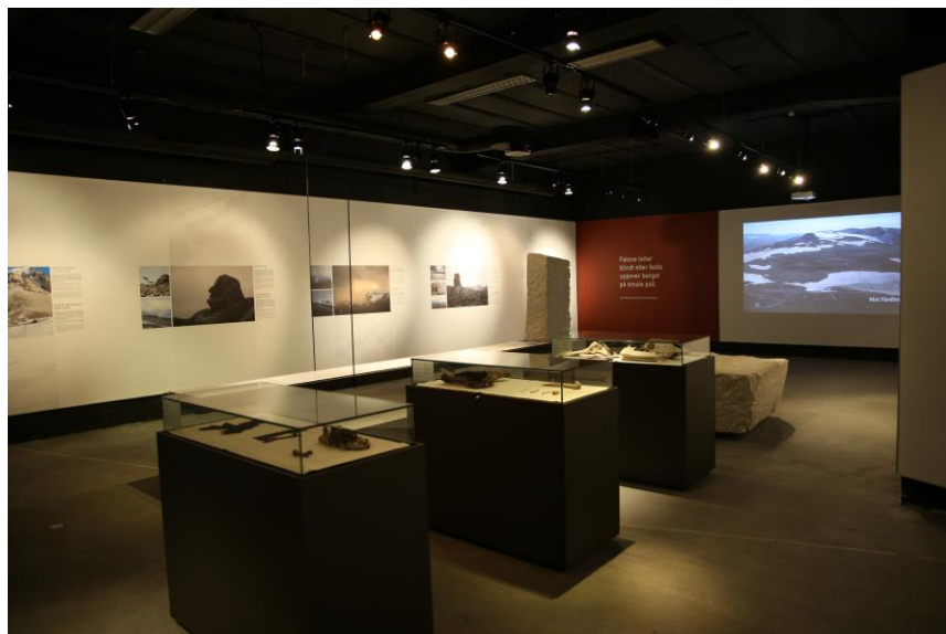
Fra utstillinga. Bildet er tatt like før åpninga.