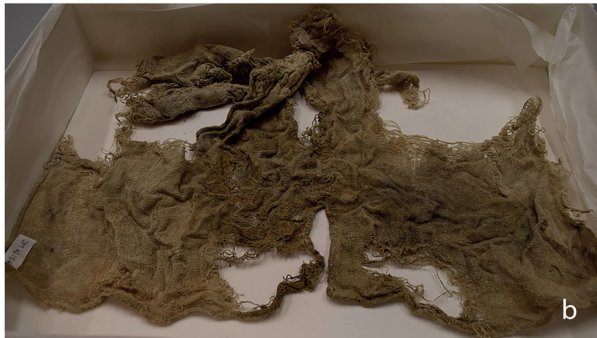
Figur 5. Textilsvepningarna som använts för att linda fostren. Fläckarna på tygen indikerar var fostren var placerade. (a) Insidan av svepningen från Gällared (14,7 x 8,5 centimeter). (b) Insidan av svepningen från Bringetofta (cirka 30 x 55 centimeter). (Foto: Elizabeth E Peacock, NTNU Vitenskapsmuseet & Stina Tegnhed, Kulturmiljö Halland).