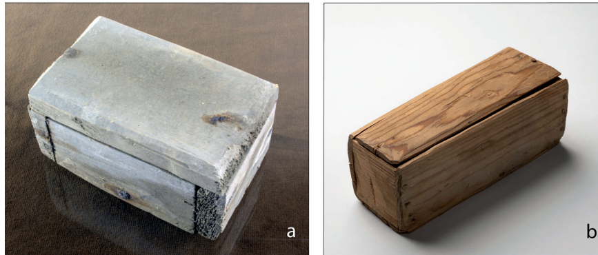
Figur 2 (a) Den stängda asken från Gällared innehållandes det svepta fostret (10,7 x 6,8 x 5,3 centimeter). (b) Asken från Bringetofta (15 x 6 x 6 centimeter; Foto: Anders Andersson, Kulturmiljö Halland & Albin Hovlin, Jönköpings läns museum).

att detta måste ske med hänsyn till de etiska aspekterna och i en respektfull dialog med kyrkans företrädare. Här utgör undersökningen av fosterbegravningen i Gällared ett exempel på hur det går att samarbeta och nå lösningar som är godtagbara för såväl arkeologer som kyrkan.