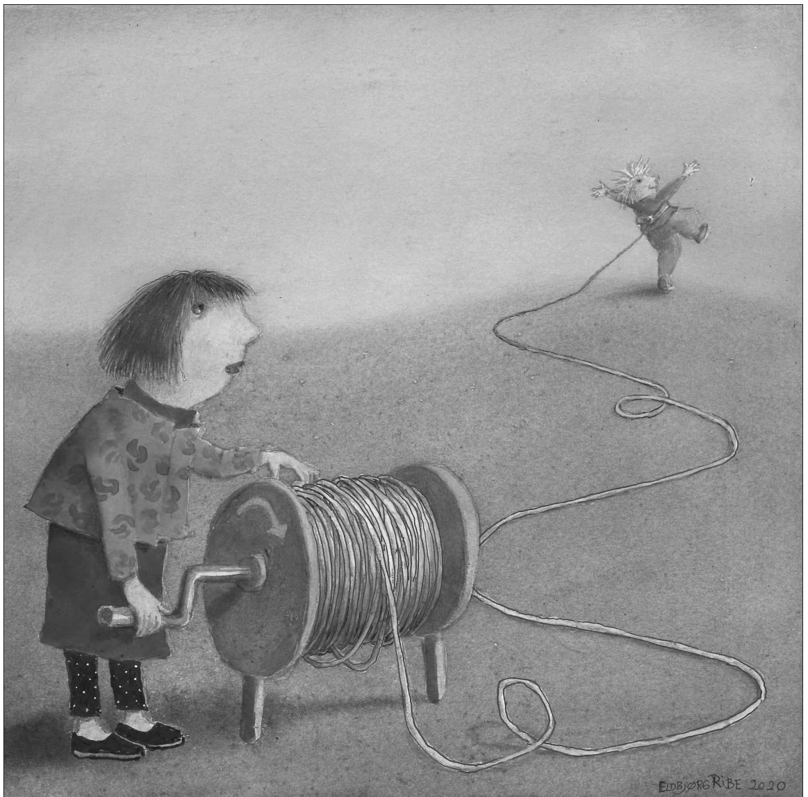
Illustrasjon: Eldbjørg Ribe