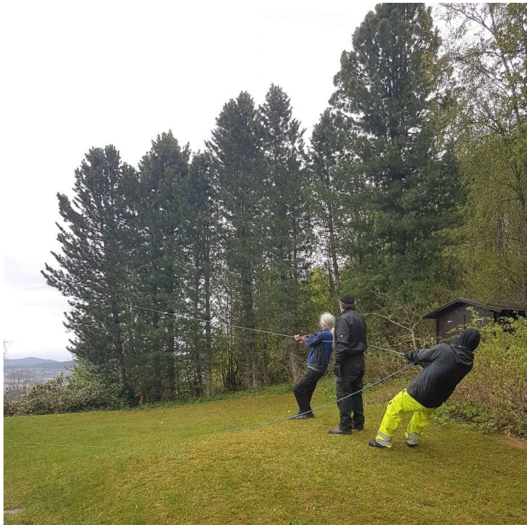
Sikring ved trefelling

Dagsverket er jo ordentlig arbeid. Det er ikke bare liksom-oppgaver som presses på oss for at vi skal ha noe å gjøre. Det er skikkelig arbeid, og vi får betalt for det.