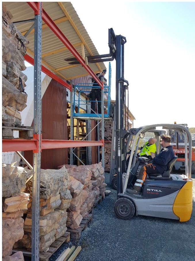
Reparering av vedstillas