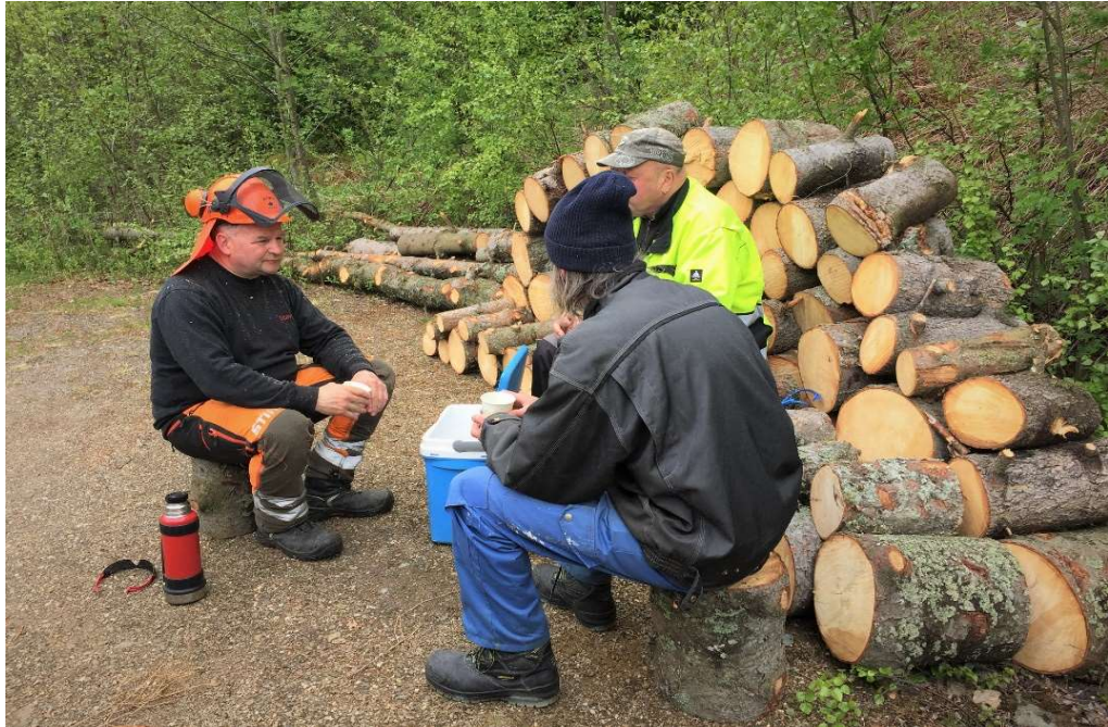
Lunsjpause etter trefelling.