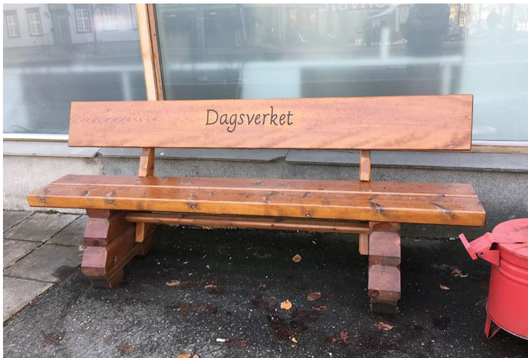
Tom røykebenk utenfor Dagsverket under Covid-19 nedstengning

Den 13. mars 2020 ble Dagsverket umiddelbart stengt, på lik linje med store deler av samfunnet. Over natten mistet deltakere ved Dagsverket arbeidstilbudet de hadde vært vant til å benytte. Arbeidshverdagen ble også snudd om på for de ansatte. Nå handlet det om å endre driften til en 'korona-vennlig' variant, og å finne måter og støtte deltakerne på i en usikker og utfordrende situasjon. En ny variant av Dagsverket kom på beina den 14. april, med redusert kapasitet, men der smittevern ble ivaretatt. Det var ikke mulig å holde mer enn 15 personer i arbeid hver dag (sett opp mot de 23 opprinnelige arbeidsplassene). Transporten av arbeidslagene la begrensninger på antallet deltakere som kunne tas med ut på arbeid. Med en-meters regelen ble det ikke mulig å fylle opp bilene slik som før. I stedet for loddtrekning ble det innført en rullerende ordning for deltakelse. Hver ettermiddag ringte arbeidslederne og gjorde avtale med de som skulle få jobbe den påfølgende dagen. Deltakerne fikk ikke lenger møte opp i fellesskap, men hvert arbeidslag måtte møte til ulike tidspunkt, for å unngå for mange personer inne i lokalene. De hyggelige morgenstundene med kaffe og prat falt dermed bort. Etter noen måneder vendte Dagsverket tilbake til loddtrekningssystemet, etter ønske fra deltakerne. Men utvelgelse ved hjelp av loddtrekning måtte fortsatt skje dagen før, og deltakerne måtte fortsatt ringes opp om arbeid.