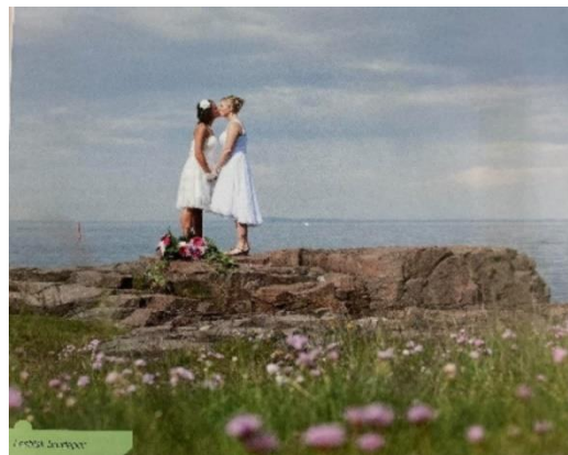
Figur 3. Lesbisk brudepar.

Under de analyserte sidene i Nova 9 brukes det fire ulike bilder, medregnet bildet på forsiden av kapitlet. Figur 3 viser et lesbisk brudepar som kysser, stående ved havkanten. Bildeteksten til bildet er «Lesbisk brudepar» (Steiniger & Wahl, 2014, s. 203). Begge står i hvite kjoler, og bildet fremstår veldig idyllisk. Bildet tar opp 2/3 av en hel side i boka. Nova 9 er den eneste av de analyserte bøkene i denne oppgaven som inkluderer et bilde av et åpent homofilt par.