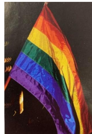
Figur 2. Regnbueflagget.

I underkapitlet om Kjærlighet og sex er det brukt to bilder. Det ene bildet er av regnbueflagget, med en beskrivelse av at det er det homofiles og lesbiske sitt flagg, og at Gilbert Baker lagde flagget i 1978 (Hannisdal et al., 2007, s. 140). Dette er en upresis beskrivelse, da det kan hevdes at flagget representerer mange flere enn bare homofile og lesbiske. Ifølge Berge (2020) vil flagget i dag representere «det skeive miljøet», som omfavner homofile, lesbiske, bifile, transseksuelle, interseksuelle og andre minoriteter på kjønns- og seksualfeltet.