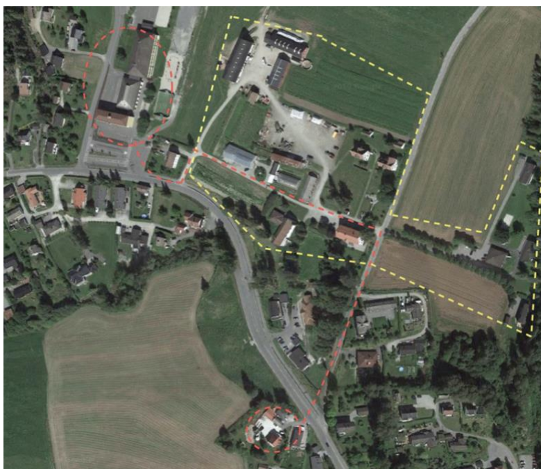
Figur 1.1: Oversiktsbilde hentet fra google maps, med linjeringer tegnet inn for å vise til min valgte skolevei, rød linje, og hvor fengselet Hassel var, innenfor gul stiplet linje. Det er usikkert hvilke jorder helt spesifikt som tilhørte Hassel, da de også drev drift med kyr som befant seg på ulike jorder i nærheten.

Det var da jeg oppdaget at Hassel var et fengsel at jeg fikk en fasinasjon for slike institusjoner. En bakgrunn fra min undring rundt at jeg aldri visste om de jeg møtte var innsatte, ansatte, besøkende eller naboer. Og ei visste helt hvor fengselet startet eller sluttet.