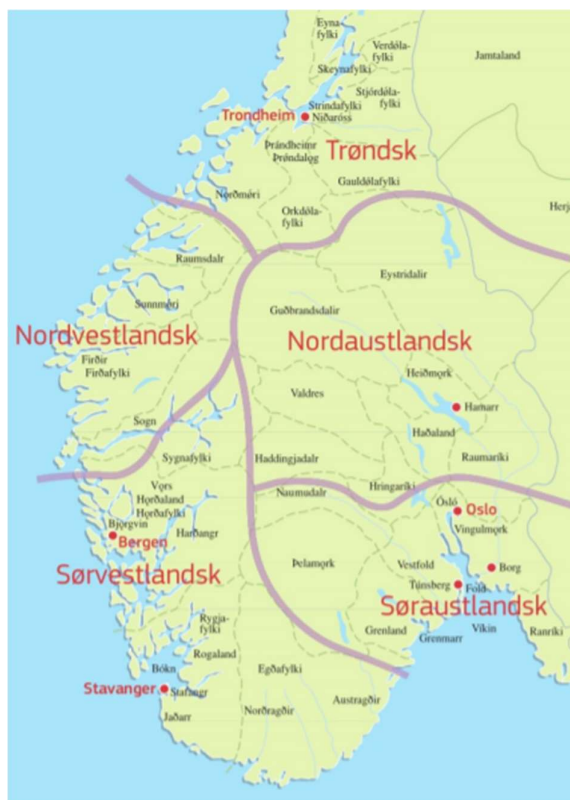
Kart 1: Kart frå Berg (2018) s. 169

Dette svarer til området på Kart 2 som er markert med segmentasjonen mm > bm .