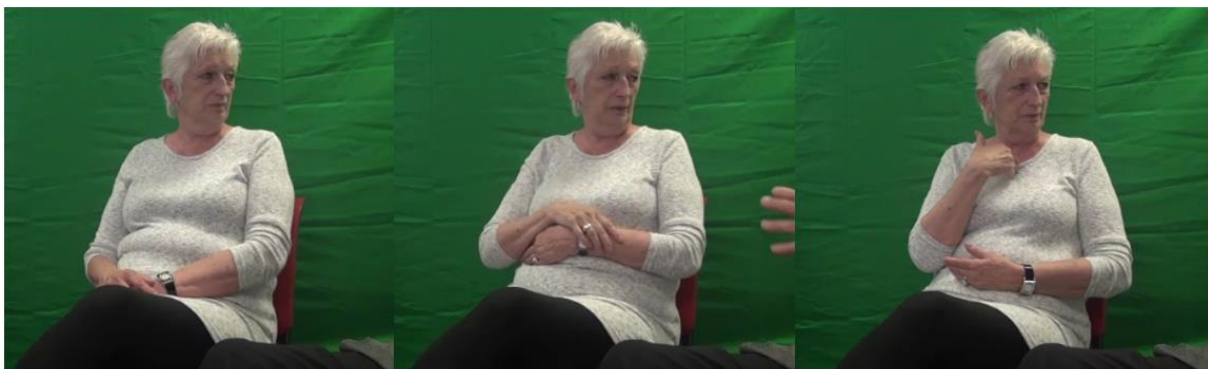
Figur 6: Eksempler på de tre hvileposisjonene, f.v. full-rest (00:03:26), half-rest (00:06:28) og quarter-rest (00:03:49).

I løpet av videoen ble det byttet flere ganger mellom de ulike hvileposisjonene. I stedet for å telle antall ganger de har byttet mellom dem, har vi sett etter når de har endret posisjonen. For å presentere hvordan de tre hvileposisjonene så ut har vi valgt ut én av deltakerne som utførte alle tre av hvileposisjonene. Eksempler på hvileposisjonene blir presentert i Figur 6.