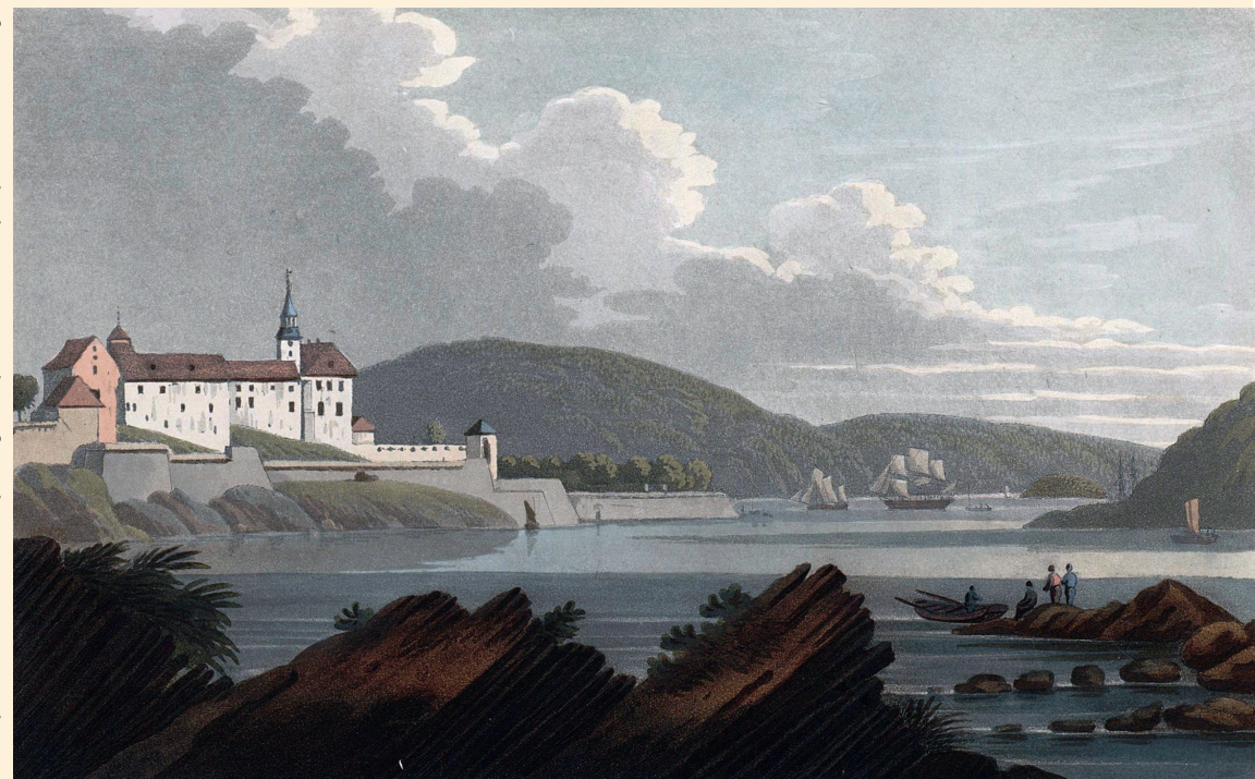
Norsk Arkivforum 27 Arkivhistorie: Samlingsforvaltning. Nye perspektiver