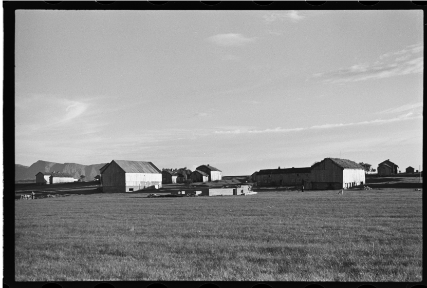
Figur 3. Her ser vi fire av fem gårder i Løvika. Lengst til venstre ser vi Løvikremma. Bilde tatt av Halvor Vreim i 1937 34

innmark og utmark, i tillegg til fjord og hav forteller historier om livet på Løvikremma. For eksempel fiskerbondens liv. Man kan si at Løvikremma er avhengig av området rundt for å fortelle historien til gården. Arkitekturen til våningshuset forteller også om naturen rundt. For eksempel det bygd sval på baksiden av huset.