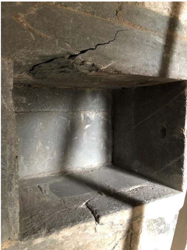
Bilde 7: Repositorium – sidealter.