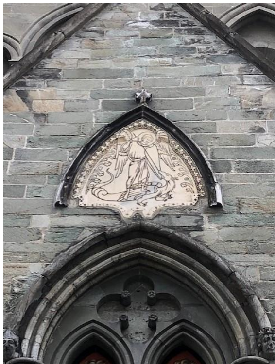
Bilde 1: Marmorplate hvor St. Mikael er risset inn.