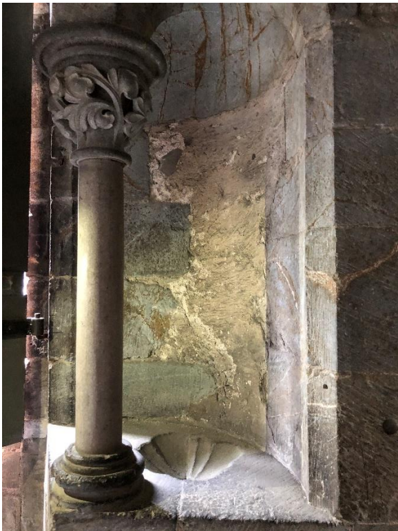
Bilde 8, 9 og 10: Piscina