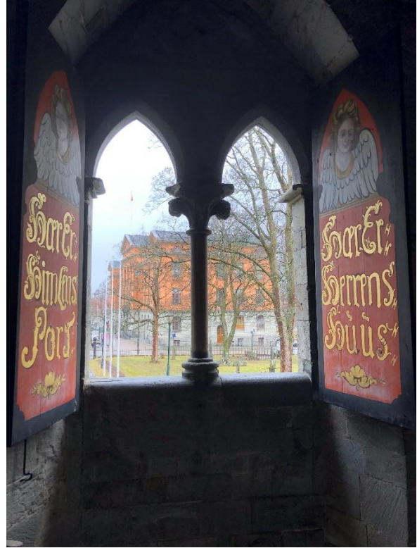
Bilde 14 og 15: Vindusåpninger i nord-veggen. Bilde 12 viser vindusåpningene fra utsiden. Bilde 15 viser vindusåpningene fra innsiden av kapellet.