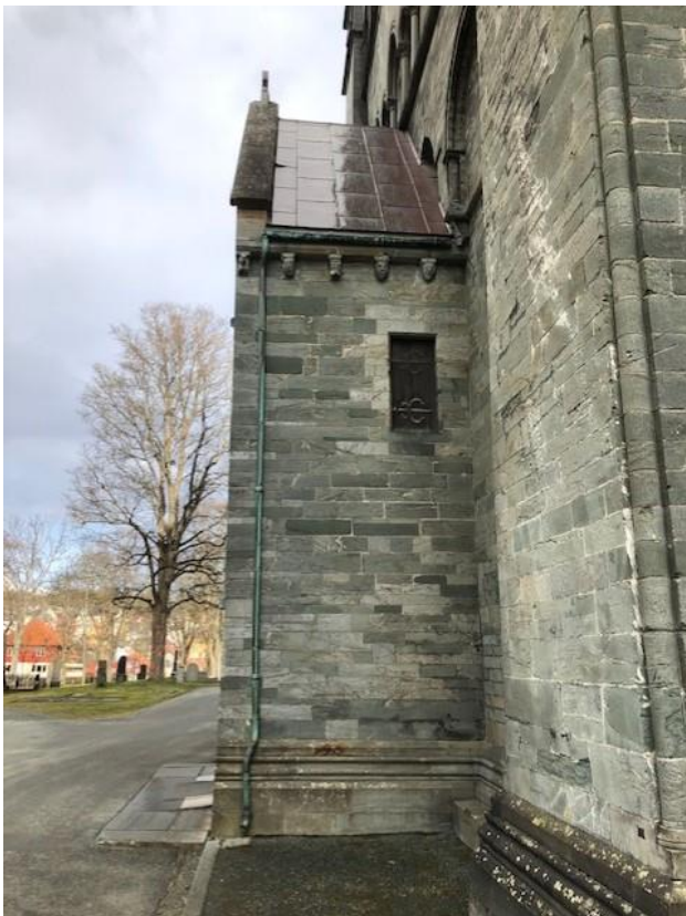
Bilde 12: Dør i høyden fra utsiden av kapellet.