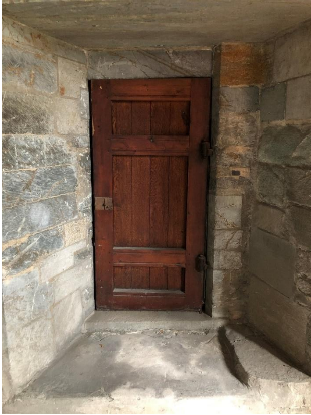
Bilde 11: Dør i høyden fra innsiden av kapellet. Fører ut i det fri.