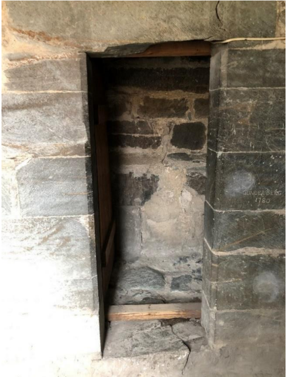
Bilde 5: Døråpning mellom gang og kapell.