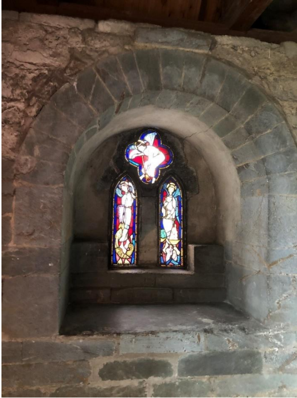
Bilde 6: Gotisk vindu/glassmaleri fra innsiden av kapellet.