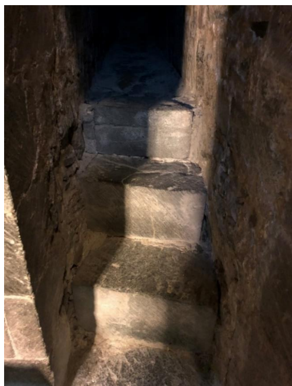
Bilde 2: Trappetrinn opp til gang på vei inn til kapellet.