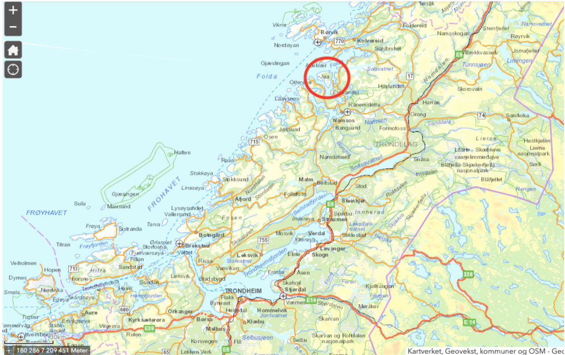
Figur 1: Jøa er en øy i Trøndelag som ligger nord for Namsos. Av Trøndelag fylkeskommune, Riksantikvaren, Kartverket og Geodata AS. ( https://stfk-gis.maps.arcgis.com/apps/webappviewer/index.html?id=65b489dc115643fb817d510b05fe1fc&fbclid=IwAR3wgI5WelN-ApAaiEeO1Ibw-grLHKeA6dlloFesPmIDEnVkjKrrAmqAjU ).