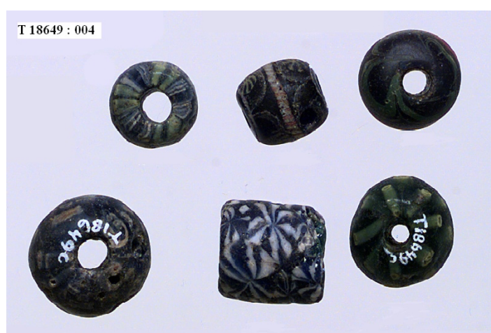
Figur 3: Perler i fra sittegrav X. Perlene var sentrale for Marstrandens tolking av gravgodset.

Grav X er en mann ifølge anatomisk institutt, mens Marstrander skriver selv at ut ifra gravgodset skulle en tro at dette var en kvinne (Marstrander, 1967, s. 7). Alder er dessverre uvisst. Han er blitt begravet med flere gravgaver. En avlang bronsespenne er dekorert med et dyr som er sett ovenfra. Her ble det også funnet en beinkam, 9 perler og to jernkniver hvor den ene hadde en tresslire delvis bevart.