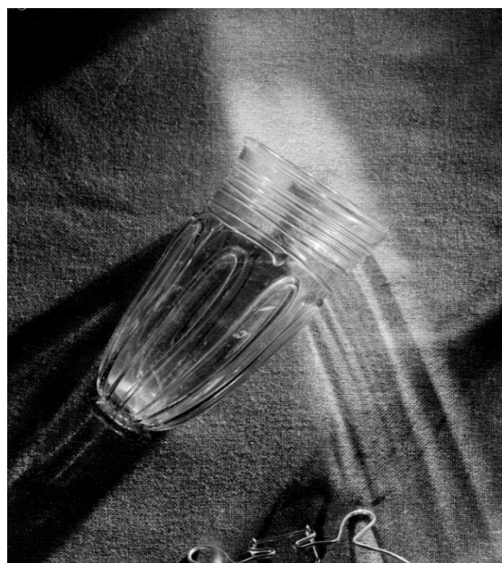
Figur 5: Glassbeger (B2272) med pålagt glasstråd. Bildet viser glassbegerfunnet fra Krosshaug på Hauge.

Hauge og Tu har begge en omdiskutert proveniens. Hunter og Sanderson nevner Skandinavia som et mulig opphav (Hunter & Sanderson: 1982, s. 22 – 29). Hauken refererer til Näsman's antydninger om Thüringen og Bayern som mulige opprinnelige produksjonsområder (se