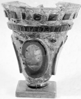
Figur 4: Konisk overfangsglass (S1494) funnet på Revhaug, Tu.

sannsynlighet hatt en sentral posisjon i det lokale, kanskje også regionale, miljøet på Jæren.