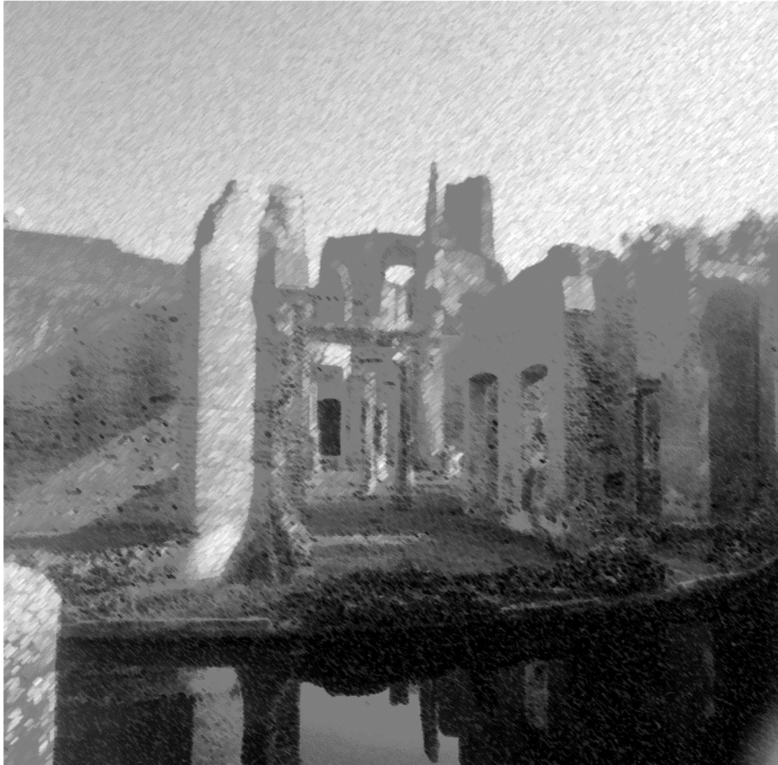
Teatro Maritimo, Villa Adriana, Tivoli.