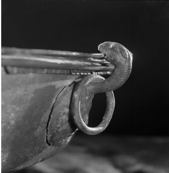
Figur 7: Bronsefatet (B2279) fra Krosshaug. Attasjen har et slangeliknende vesen som fester hanken til randen av karet. Hankefestet preges av et menneskeansikt.

I tillegg til glassbegrene ble det funnet to ulike bronsekar; et bronsefat og en vestlandskjele. Bronsefatet (B2269) ble funnet sammen med det trådpålagte glassbegeret i den ubrente kvinnegraven på Krosshaug. Det ble funnet i en hellekiste med innvendig kammer (se Hauken: 2014, appendiks 1, s. 141). Hauken tolket det som et unikt funn med tanke på at det ble funnet sammen med et glassbeger og på grunn av dens utseende (Hauken: 2014, s. 63 & 65). Hun legger videre til noen interessante aspekter ved bronsefatets utseende. For det første