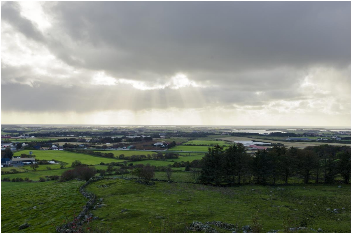
Figur 3 Utsikt over Jæren fra Tinghaug. Et sentralt punkt i jernalderen med flere gravfelt i nærheten, blant annet kvinnegraven på Krosshaug.

området som følge av blant annet høy menneskelig jordbruksaktivitet i bronsealderen (Prøsch-Danielsen & Simonsen: 2000, s. 40 – 41). Dette er en forandring som åpnet opp for et mer vidåpent landskap med fruktbar jord å dyrke i. Andre forandringer kom i løpet av og etter 1800- tallet, da moderniseringsperioden preget landskapet for fullt (Lillehammer: 2014, s. 5). Slike forandringer gjør at landskapet foretar et hamskifte og dermed endrer de fysiske forutsetningene for jordbruksdrift. Forskjellen jernalderens og dagens Jæren er at det i dag ikke lenger innehar den samme politiske og sosiale funksjonen, men en geografisk høyde som skuer utover Jæren.