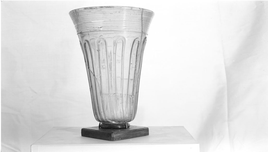
Figur 6: Glasstrådpålagt beger (S1479) fra Ådnehaugen på Tu.

Hauken: 2014, s. 65 & Näsman: 1984, s. 81). En tredje oppfatning er at begeret kommer opprinnelig fra områder i Belgia eller Nord-Frankrike (Magnus: 1975, s. 104). Dette er tre ulike oppfatninger av proveniensen til de glasstrådpålagte begrene og alle indikerer at glassbegrene har sitt opphav fra områder i det nordvestlige Europa.