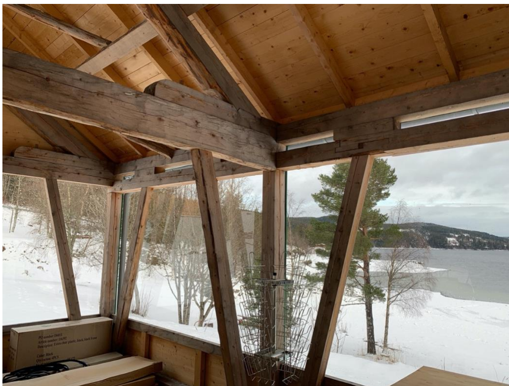
Figur 3: Deler av tak- og veggkonstruksjonen i nybygget.

Grunnarbeidet med nybygget, med oppsetting av ringmur og plattformgulv, utførte laget selv med dugnadsgjeng før studentene kom og satte i gang med råbygget. Det var spesielt interessant å høre om arbeidet med tak- og veggkonstruksjonen som er basert på tradisjonelt bygghåndverk. Her er det tydelig at hensynet til bygningsmiljøet på tunet samt den regionale byggeskikken har blitt tatt vare på, da konstruksjonen er basert på trøndersk sperreverk – en regionalt kjent låvekonstruksjon. Bygget kan derfor tillegges en grad av prosessuell autentisitet, fordi det har blitt brukt en original byggeteknikk som samsvarer med den regionale byggeskikken. Treverket til konstruksjonen hentet studentene fra tradisjonelt bygghåndverk og teknisk bygningsvern selv fra skogen i Klæbu. Under byggingen av konstruksjonen har studentene brukt tradisjonelle verktøy, og i tillegg spikket de egne hammere og treplugger. 107 De tradisjonelle redskapene kan knyttes til ideen om prosessuell autentisitet, da Leden utdyper i «Bygningsvern i museer» (2017) prosessuell autentisitet med at arbeid på verneverdige bygninger skal gjøres i tråd med opprinnelige teknikker og materialer. 108