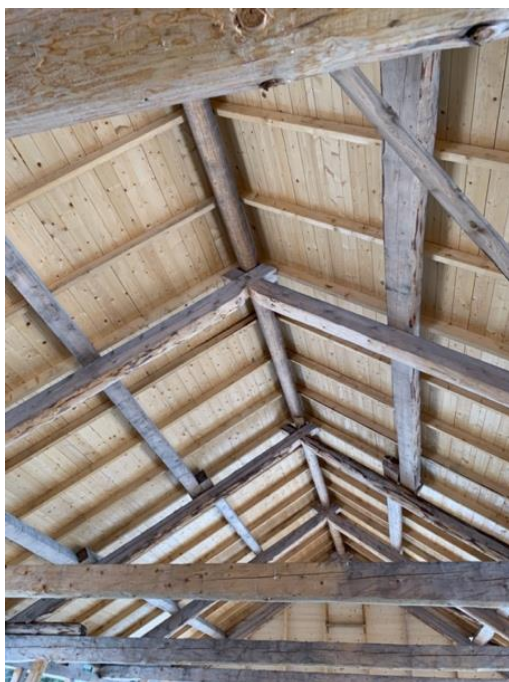
Figur 2: Takkonstruksjonen i nybygget.