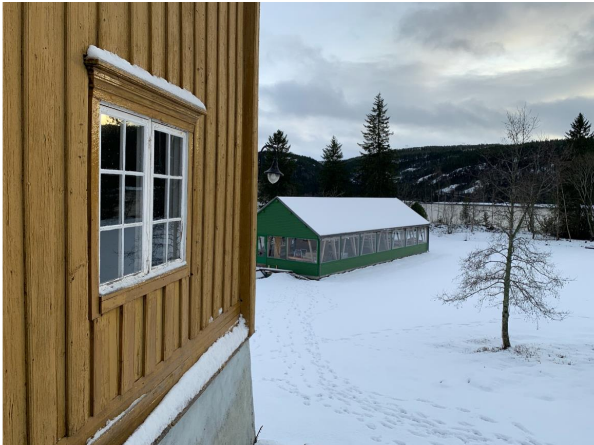
Figur 1: I bakgrunnen ser man nybygget, malt i grønt. Tak- og veggkonstruksjonen er basert på tradisjonshåndverk. Foto: Oda Svisdal, januar 2020.