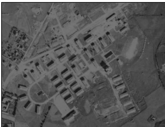
Figur 1: Ortofotograf av Persaunet (1947).

Ved å følge Noras resonnement på Jones' prinsipper, vil kulturlandskapet, som Persaunet leir, lades med visse budskap når landskapet innrømmes en plass i det kollektive minne. Denne innrømmelsen fører følgende til at landskapet gjøres til et lieux de mémoire. Likevel er det viktig å skille (minne)landskapet fra minnesteer som objekter (plaketter, monumenter og lignende), da minnelandskapene gjennom sin romlige dimensjon sprenger rammene for minneobjektet jamfør Eriksen-plaketten. Gjennom den stedlige kontinuiteten fungerer minnelandskapet som både formidler av fortiden, samtidig som at fortiden legitimeres, slik Owen J. Dwyer og Derek H. Aldermann hevder. 62 Denne legitimiteten er likevel ikke en immanent kvalitet ved minnesteet, tross stedlig kontinuitet, men er som