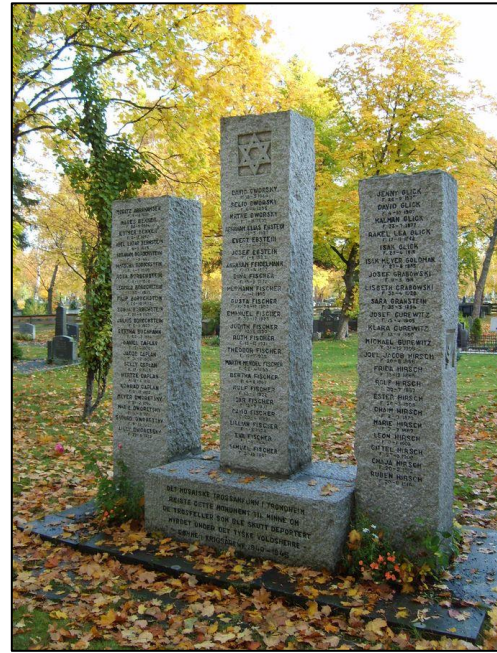
Figur 7: Holocaust-minnstedet på Lademoen (1947).

Hvis vi ønsker at modvirke glemsel og holde erindringen i live, må vi derfor også være åpne for forskjellige representasjonsformer, herunder fiktionaliseringer. Den stadig større tidslige og generationsmessige afstand til den faktiske erfaring af holocaust har således også i en vis forstand sat erindringen fri til at fokusere på mere end blot kendsgerningerne. Vi er