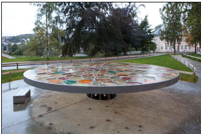
Figur 5: Julius Paltiels plass (2015).