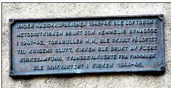
Figur 4: Markering på metodistkirken i Trondheim (1981).

Holocaust fra et trøndersk perspektiv Før «jødeparagrafens» opphevelse i 1851 skal det ikke ha bodd jøder i Trondheim, men i de følgende tiårene er det dokumentert en viss jødisk innvandring, hovedsakelig fra Sverige, Polen og Baltikum. I 1900 hadde antallet jøder i Trondheim steget til 119, 79 og samme år kjøpte den nyopprettede jødiske menigheten en parsell på Lademoen kirkegård, fortsatt i bruk som det