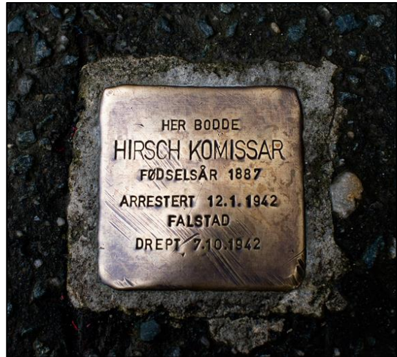
Figur 8: Snublestein over Hirsch Kommissar (2012).

Geordnetheit des Textes unterbrechen». 106 Den manglende informasjonen, eller Leerstellen , illustrert i figur 8, provoserer fram refleksjon hos tilskueren, med påfølgende aksjon. Disse Leerstellen kan også ses i Julius Paltiels plass (figur 5) og Cissi Klein-statuen (figur 6). Det er også interessant å bemerke at dette ikke er tilfellet for bautasteinene på Lademoen (figur 7) som ligger mye nærmere krigen tidsmessig. Denne søker i kontrast å skape en lukket beskjed uten rom for ekstern påvirkning, noe som også viser eksplisitt til utviklingen i den estetiske tradisjonen ved minnesteder.