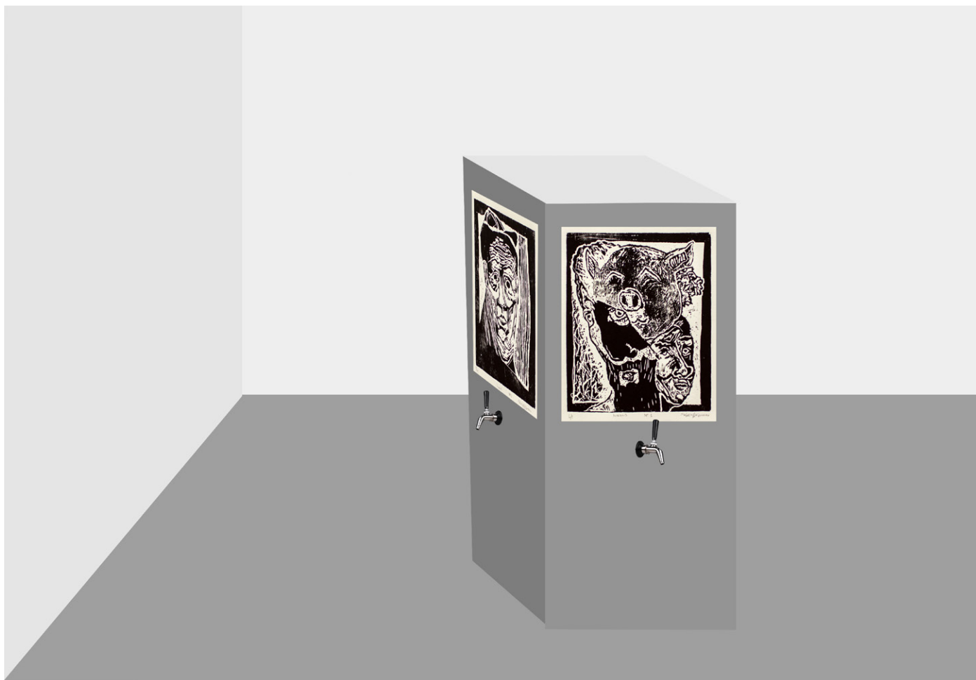
Bachelor udstillings koncept og visualisering af den fysiske form. 2020