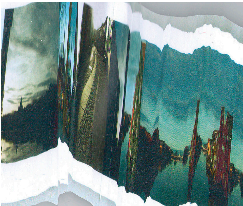
Nærbillede af fuckd panorama ”Reclaiming the panorama - memory lake. 2018.

Det kunne være en drøm at kunne brygge øl og skabe en lille smule profit, så jeg kunne have et galleri som udstiller samtidskunst. Jeg tror det er den fremadrettede drøm, men spørg mig igen om 2 måneder, og måske er der dér kommet nye ideer.