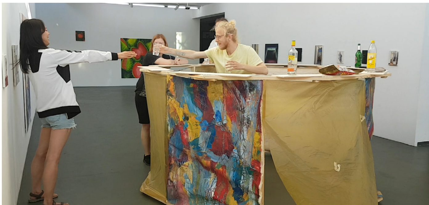
Dokumentation af Impossibile bar. Baren til udstillingsåbningen af student initiativ taget udstilling, 2019. Baren er spændt fast til bartenderen, så når bartenderen bevæger sig, bevæger baren sig.