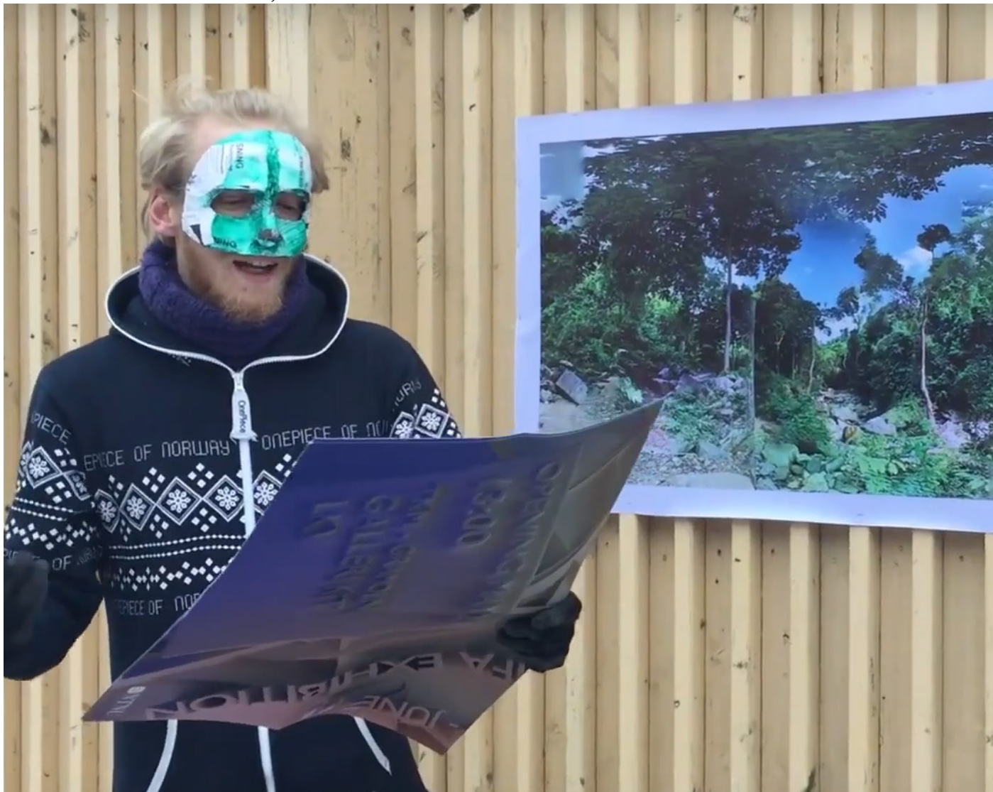
Dokumentations billede fra Ulovlig kommunal udstilling performance, 2018.