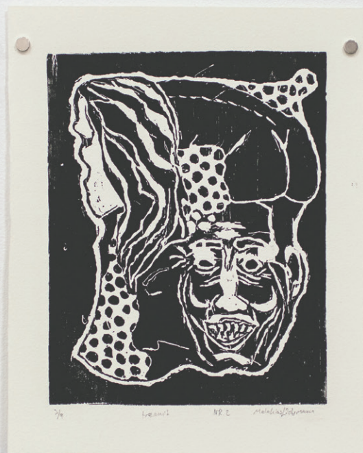
Træsnit serie - NR. 2 ud af 29 grafiske tryk. 2019-2020(?)

Jeg vil personligt som afsender gerne være den som performer - som en bartender der rækker min ny mixede drink til gæsten af stedet. Eller tjeneren som videregiver maden fra køkkenet til gæsten.