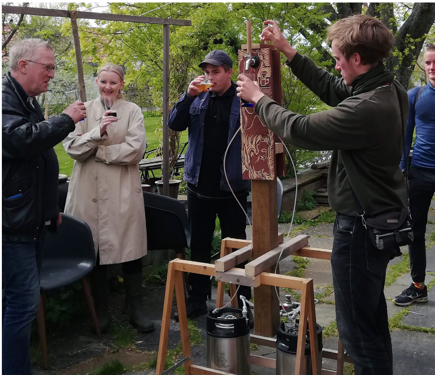
Dokumentation for "Alternativ Bachelor udstilling" ved værk navnet NR. 30