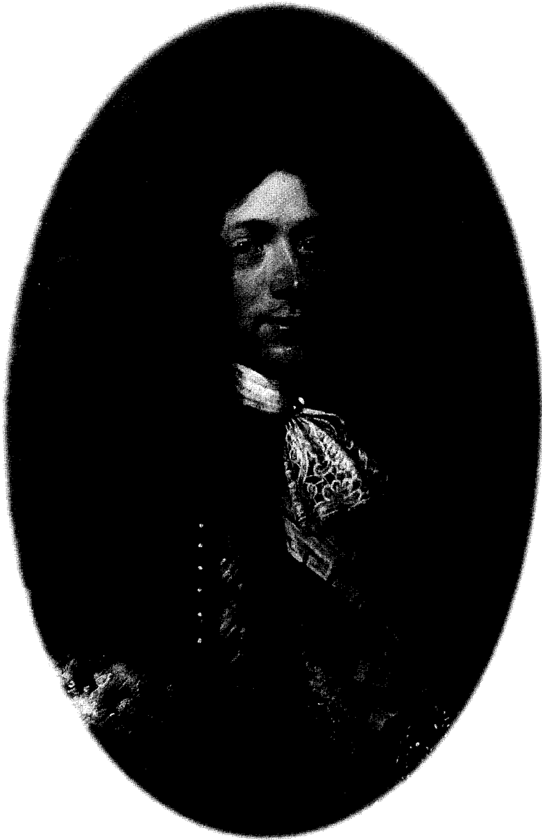
Peter Schumacher Griffenfeld (1635-1699). Malt av Abraham Wuchter. Det Nationalhistoriske Museum på Frederiksborg Slot, Hillerød, Danmark.