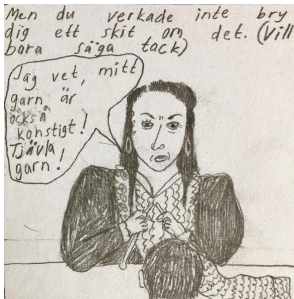
(Figur 5: Wiksten, 2016, s. 130)

Wiksten viser på denne måten hvordan man kan bidra til å avstigmatisere mennesker med sosial angst, ved å tegne ut en karakter som ikke bryr seg om en setning høres rar eller knotete ut, i figur 5. Hun avstigmatiserer ved å ikke reagere, for noen ganger er det best å la ting passere. Dette henviser til hvordan termen grafisk medisin fungerer, der vi som lesere får innblikk i hvordan psykiske lidelser (som sosial angst) fungerer innenfra, og hvordan det hemmer. I tillegg får vi se hvordan man som pårørende eller observerende på en subtil måte kan respondere og hjelpe.