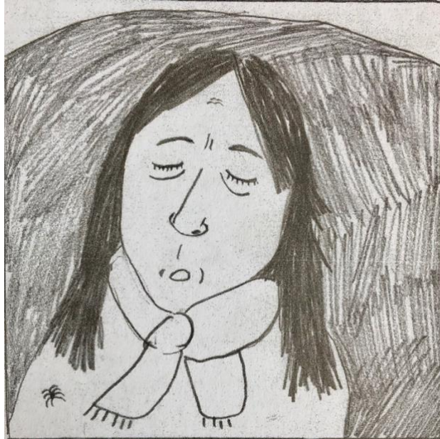
(Figur 8: Wiksten, 2016, s. 162)