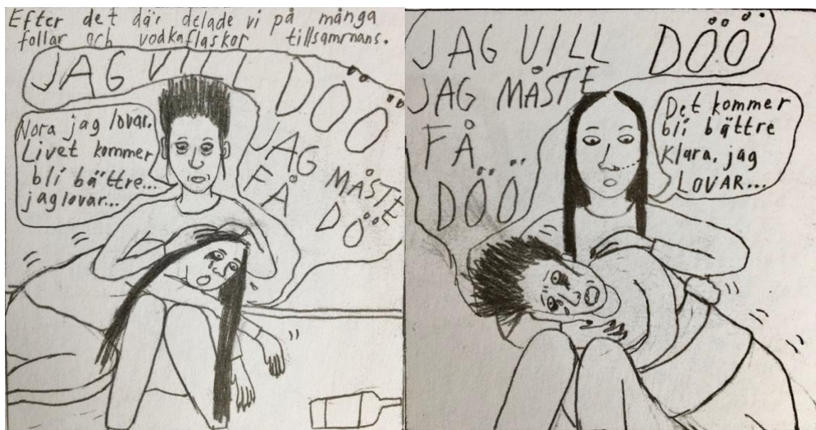
(Figur 6 og 7: Wiksten, 2016, s. 46)

Da venninnene møtes flere år etter å ikke ha sett hverandre, er det usikkert om Klara er syk, men Nora er tydelig det. På grunn av fortiden de har, er spørsmålet om hvor mye man skal stille opp for syke venner, og på hvilken måte, viktig å se på. På side 46 i boka, gjengitt i figur 6 og 7, ser vi hvordan venninnene har påvirket hverandre og byttet på å være offer og den som passer på. De veksler på å være suicidale når de drikker, som vi ser i den første ruta, når Nora blir passet på av Klara: «Efter det där delade vi på många follar och vodkaflaskor tillsammans» skriver Klara øverst i ruten. Så ser vi samtalen deres, der Nora sier: «JAG VILL DÖÖ JAG MÅSTE FÅ DÖ», mens Klara trøster: «Nora jag lovar. Livet kommer bli bättre... jag lovar...». I andre rute ser vi hvordan karakterene har byttet om, der Klara nå roper: «JAG VILL DÖÖ JAG MÅSTE FÅ DÖ» og Nora trøster: «Det kommer bli bättre Klara, jag lovar...» (Wiksten, 2016, s. 46). Teksten inne i snakkeboblene på denne siden, viser store og dramatiske bokstaver. Dette grepet er også en del av tegneseriemediets måte å visualisere dialoger som blir skildret på en helt annen måte i tradisjonelle romaner. De store bokstavene symboliserer den dramatiske hendelsen i Klaras minne.