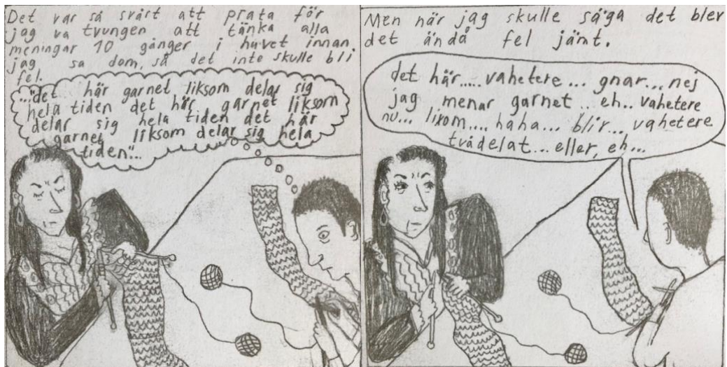
(Figur 3 og 4: Wiksten, 2016, s. 130)