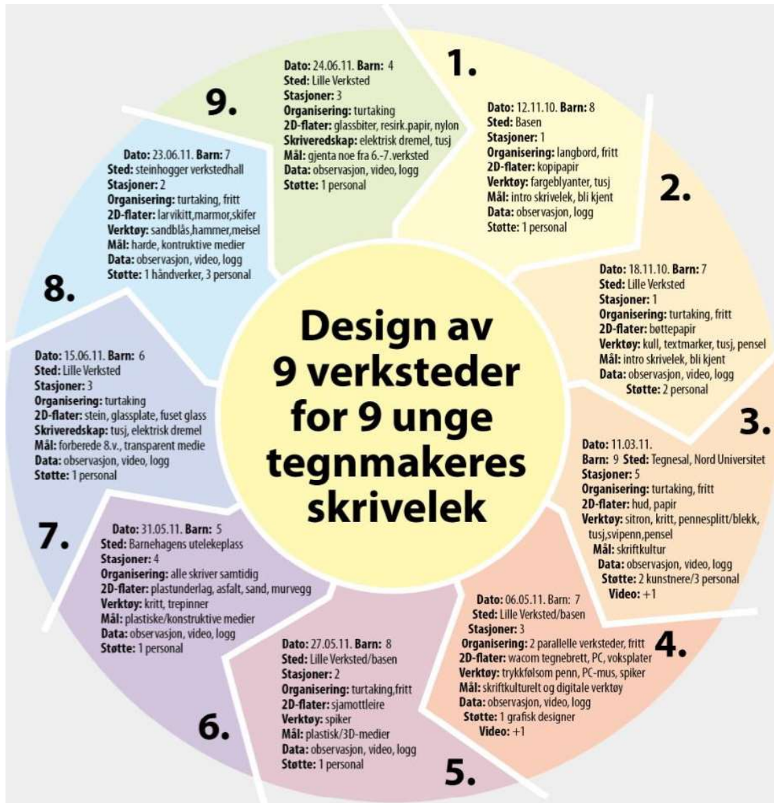
Figur 1. Modell over designprosessen i forskningsprosjektet «Are You Experienced?»

Figur 1 er basert på uformelle diskusjoner med eksterne ressurspersoner rundt utvikling av en modell som kunne framstille prosjektet som en dynamisk prosess. En sirkulær form med retningsgivende felt ble valgt for å lette leserens visuelle persepsjon av prosjektet som en tidsavgrenset og helhetlig syklus. Sirkelformen åpner for en hermeneutisk fortolkning av prosjektets deler og helhet (Gadamer, 1960/2010). Prosessens kronologi ble understreket via stigende nummerering. En nedtonet regnbuelignende fargepalett ble valgt for å visualisere at hvert verkstedfelt inngikk i en større helhet. Modellens parametere var essensen av prosjektdesignet. For å få plass til nødvendig tekst i hvert verkstedfelt, måtte tekstene komprimeres til et minimum. Jeg ser at dette kan ha gått utover parameternes tydelighet. Det kan virke inn på leserens fortolkning av modellen. En måte å forbedre modellen på kunne vært å redusere antall parametere.