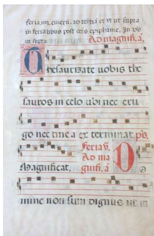
Figur 2. Kalveskinn med håndskrevne neumer og latinsk skrift.

Det andre produktet omhandler en kunstformidlingssekvens fra et verksted som innledes av en narrativ vignett, forfattet etter samtale med ekstern ressursperson som var engasjert i iscenesettelsen av denne verkstedstasjonen i 2011. Som inspirasjon til egen skrivelek fikk barna se (og høre) et kalveskinnstykke med håndskrevet latinsk salmetekst og neumer , en kategori notasjon brukt til nedtegning av enstemmig vokalmusikk (Ledang, 2018) 1 . Tekst og noter er komponert inn på begge skinnets flater, og verket er innrammet av glass på begge sider. Det gjør at den som tolker må vende verket midtveis i avlesningen. Her følger et foto jeg tok av kunstverket 23.07.19. Det ble avfotografert mot et vindu som muliggjorde glimt av det løvtynne skinnstykkets bakside. Fotoet er beskåret for å fjerne gjenskinnet fra fotokamera.