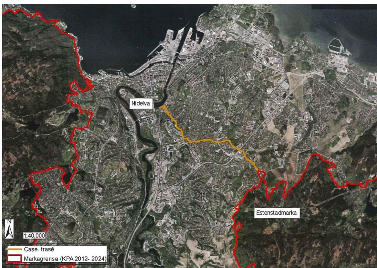
Figur 2. Gangveg/turveg fra Nidelva til Estenstadmarka, Trondheim. Traseen.