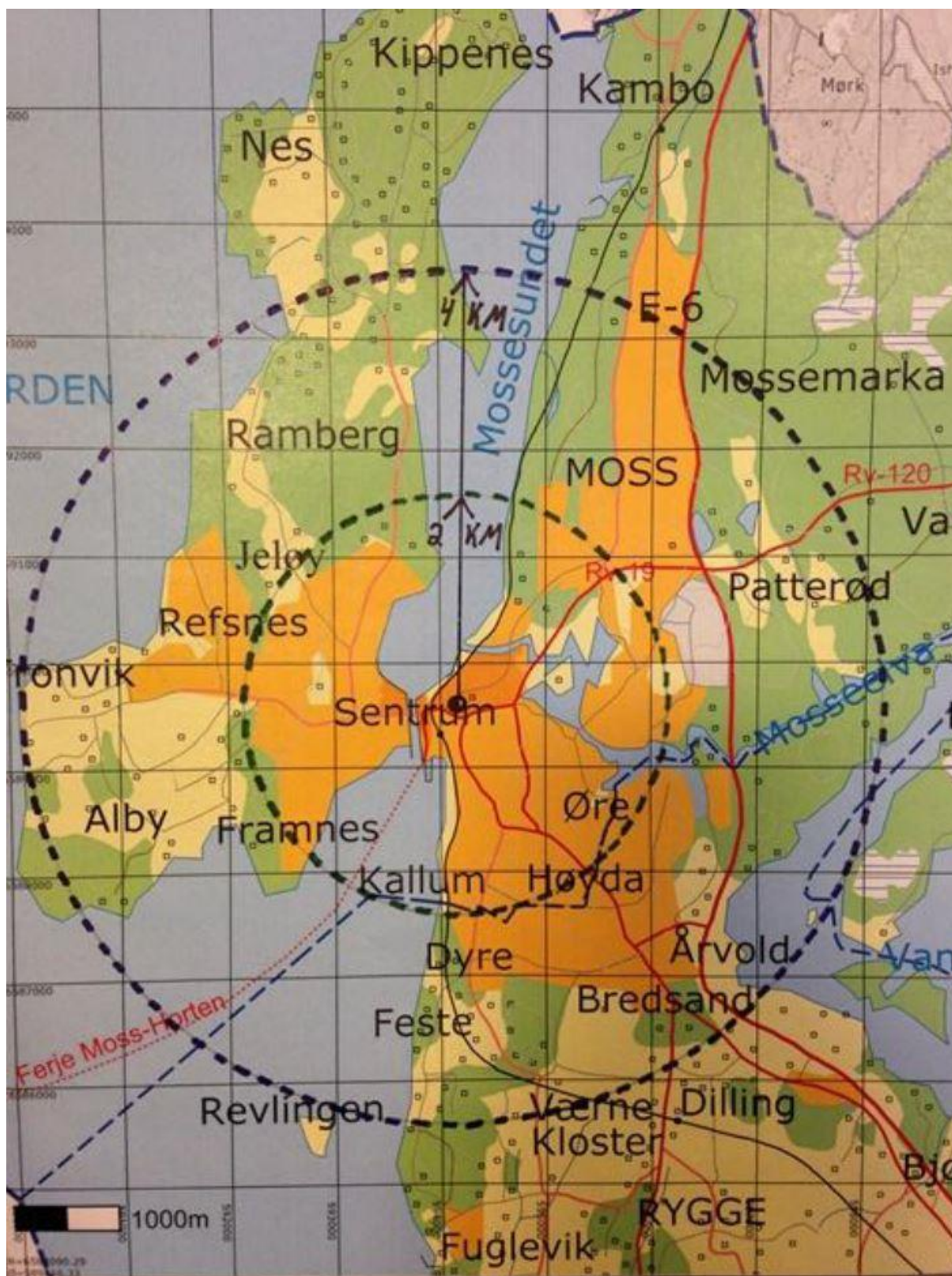
Figur 3. Kart over Moss som viser avstanden fra sentrum i en radius på 2 km og 4 km. Kilde: Moss kommune. Handlingsplan for transport 2014 - 2020, s. 6.

Nærtur som folkehelse er tillagt avdeling for Helse og omsorg . Folkehelsekoordinatoren i Moss var tidligere en del av et tverrfaglig team på Plan og utvikling . Dette teamet ble oppløst