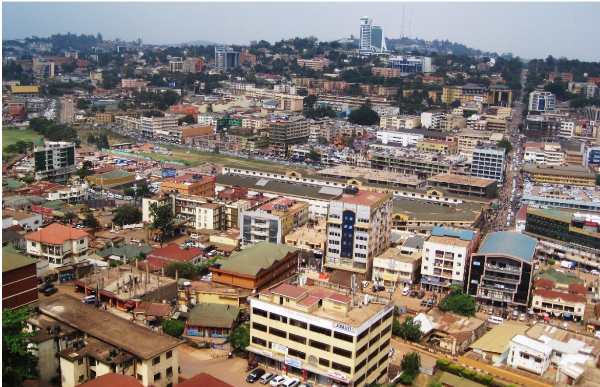
Figur 1 - Kampala i retning nord-øst sett fra Uganda National Mosque på Kampala Hill i Old Kampala.

Uganda er et land i Øst-Afrika med 42,86 millioner innbyggere, 1 hvorav de fleste av disse bor på landsbygda. Det nasjonale språket er engelsk og swahili, men i hovedstaden Kampala, der jeg holdt til, snakker store deler av befolkningen luganda, som er et bantuspråk 2 snakket av Ganda, den største etniske gruppen i Uganda. Ganda holder til i Kampala og området rundt.