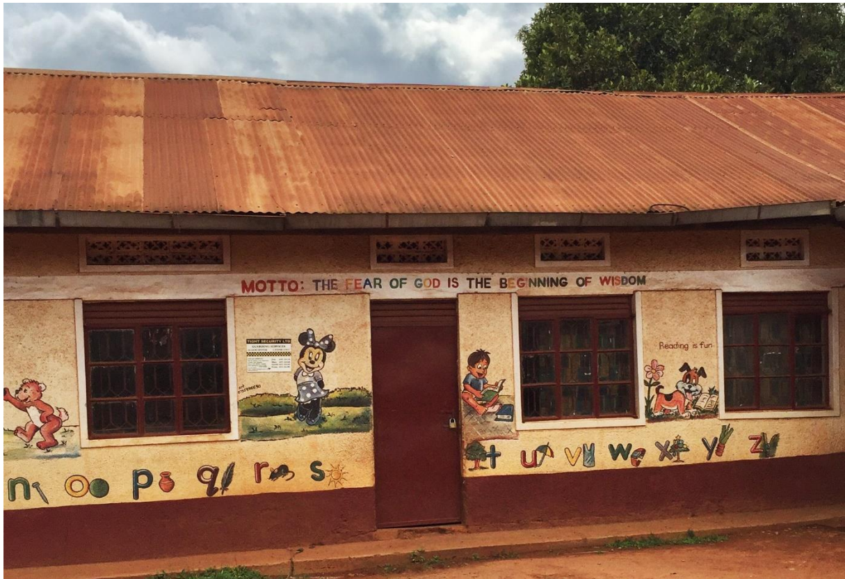
Figur 2 – Den lokale skolen hvor «Motto: The Fear of God is the Beginning of Wisdom" er malt i fargerike bokstaver på veggen.