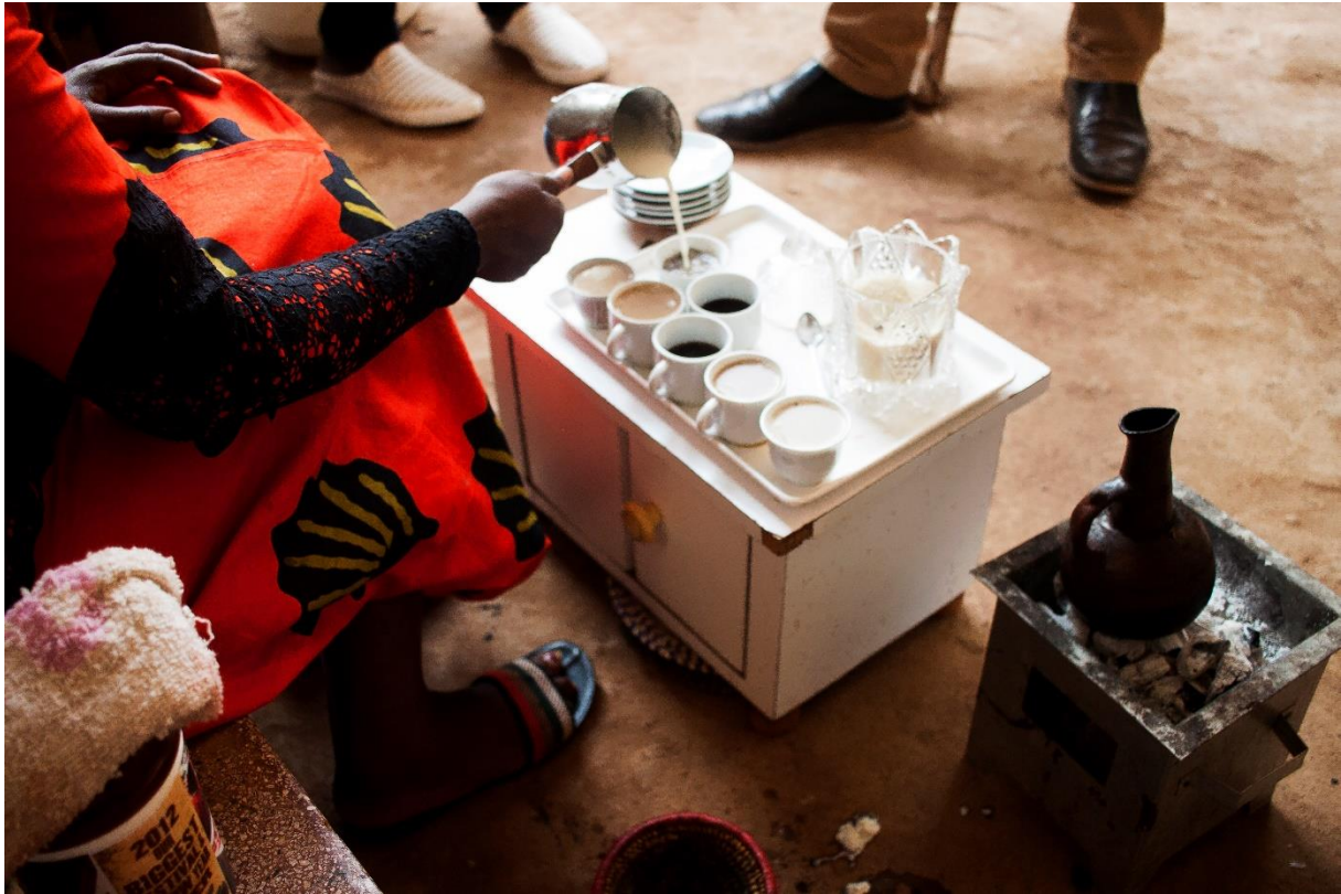
Figur 3 - Gloria sittende i bakgården med kaffebordet sitt, der hun lager kaffe til gjestene sine.

bak kaffebordet og måler små skjeer med sukker som hun putter i hver lille kopp, at hun koser seg.