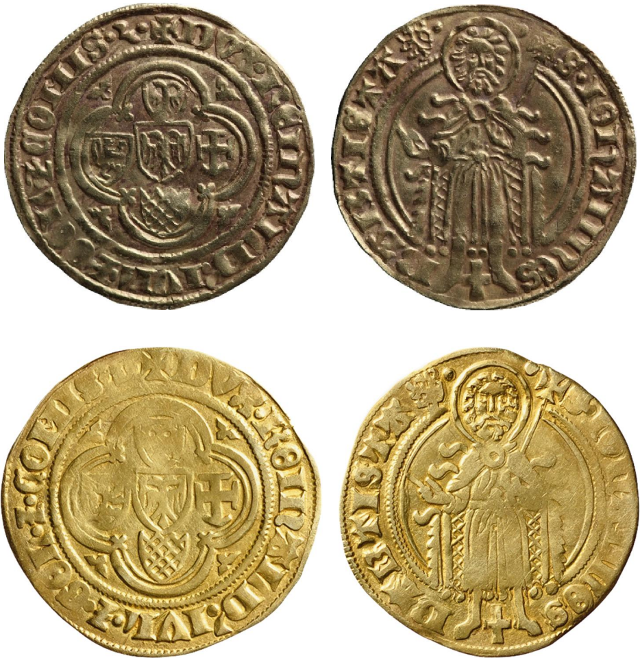
Figuur 3 – Reinaldusgulden met scherpe Æ (boven) en ronde Θ (onder)

(schaal 175%)