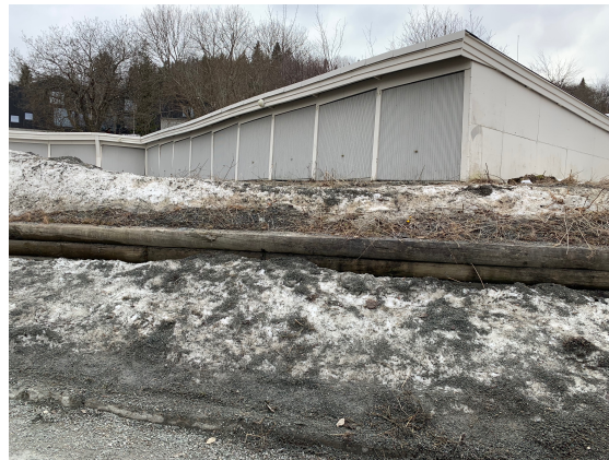
Illustrasjon 8 24

Illustrasjon 6-8 viser fargesetting av Hammersborg borettslag i dag. Enkelte boliger har fortsatt en kulørt fargesetting, men området domineres av hvite og grå hus. En del hus har også et påbygg i form av en nymodernistisk kasse kledd med smalt panel som enten er beiset eller malt i en brun tone. Disse ble oppført under rehabiliteringen som pågikk fra 2007-2009.