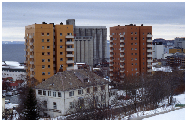
Illustrasjon 1 18

Dagens fargesetting av Bynesveien 4A+B og 6. Punkthusene er platekledd i ensartede dempede røde og gule farger. Det at husene er platekledd gir de et mer intetsigende utseende og det er ikke like lett avgjøre bygningens alder ved å bare se på dem.