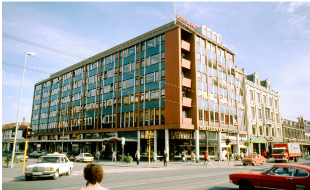
Illustrasjon 3 20

er ikke bærende da det er bruk av pilotis i konstruksjonen som bærer bygningen, disse er synlige i de to nederste etasjene.