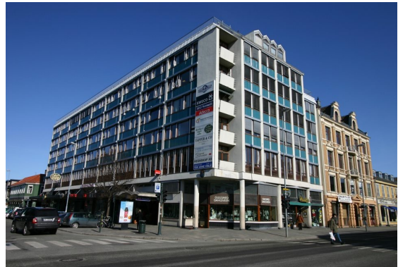
Illustrasjon 4 21

Illustrasjon 4 viser dagens fargesetting. Det brune er blitt hvitmalt, men de turkise platefeltene under vinduene er beholdt. Bygningen framstår som et kaldere innslag i miljøet enn ved foregående fargesetting.