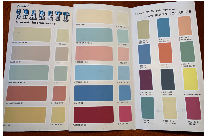
Fargekart fra ca. 1961.

andre farger kan bli masete og rett og slett stygge om de settes sammen. Derfor er fargesetting av arkitekturen av betydning. Fargene på en bygning og et bygningsmiljø påvirker vår opplevelse av den, generelt gjelder dette alle våre bygde omgivelser. Fargevalg er viktig når man fargesetter både innendørs og utendørs.