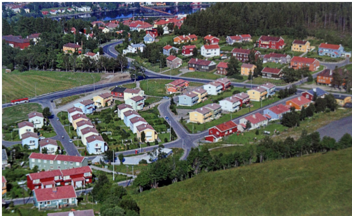
Illustrasjon 5 22

Illustrasjon 4 viser dagens fargesetting. Det brune er blitt hvitmalt, men de turkise platefeltene under vinduene er beholdt. Bygningen framstår som et kaldere innslag i miljøet enn ved foregående fargesetting.