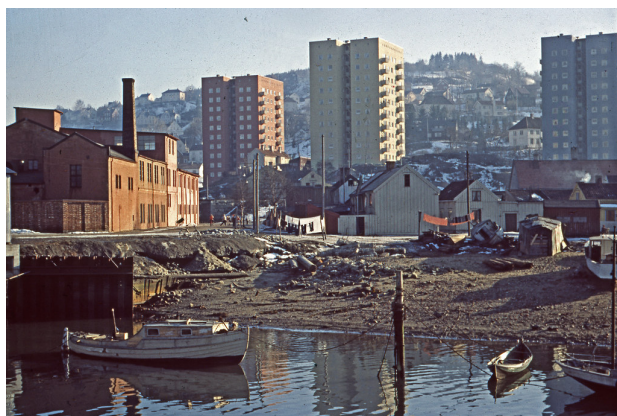
Illustrasjon 2 19

Dagens fargesetting av Bynesveien 4A+B og 6. Punkthusene er platekledd i ensartede dempede røde og gule farger. Det at husene er platekledd gir de et mer intetsigende utseende og det er ikke like lett avgjøre bygningens alder ved å bare se på dem.