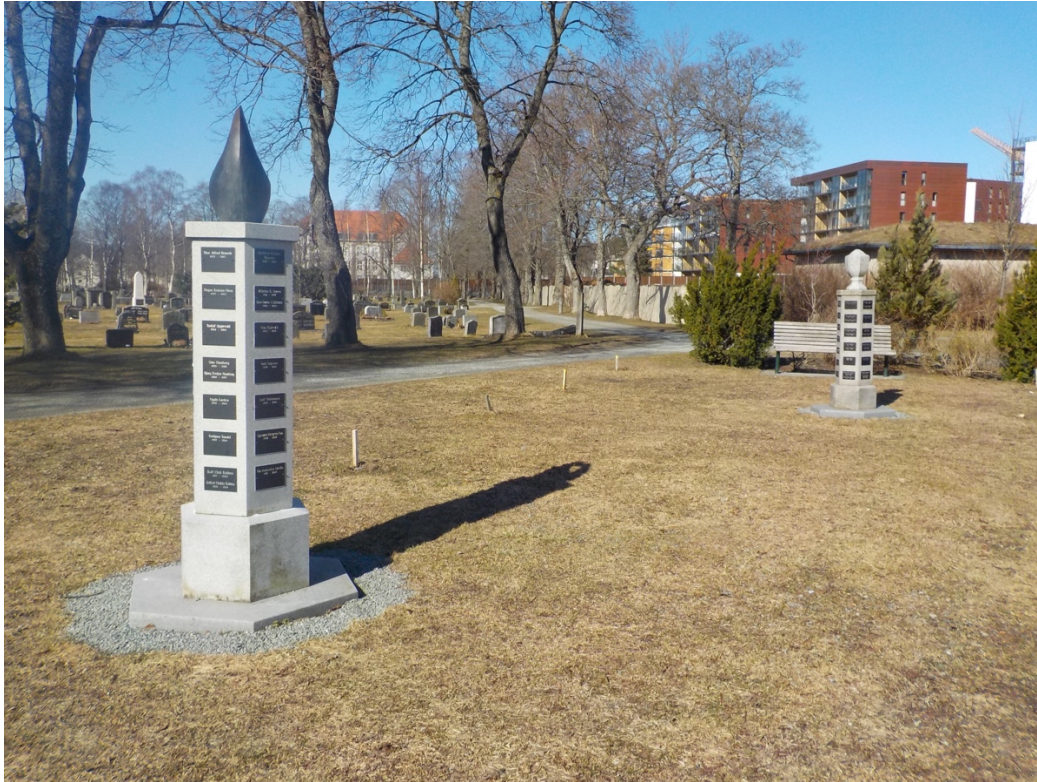
Bilde 12: Navnet minnelund på Lademoen kirkegård.