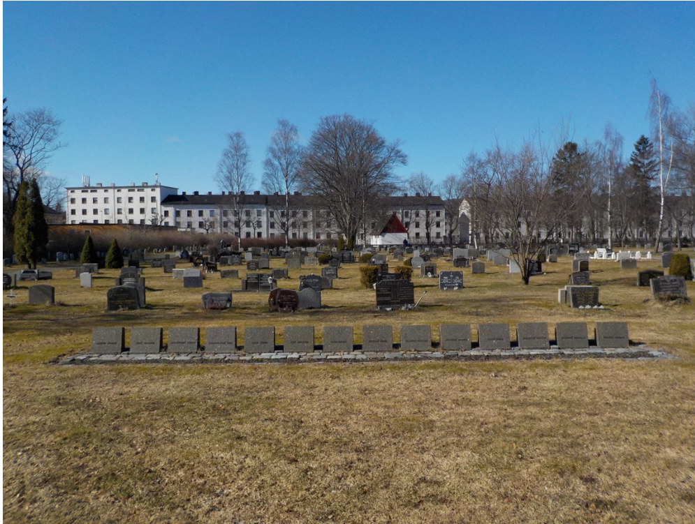
Bilde 6: Rekken med steiner markerer rammen på den sovjetiske krigsgraven, foran den åpne plassen.