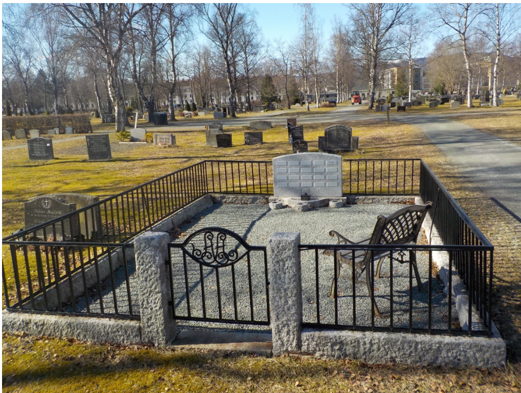
Bilde 11: Nedslipt gravminne, klar som navnet minnelund.