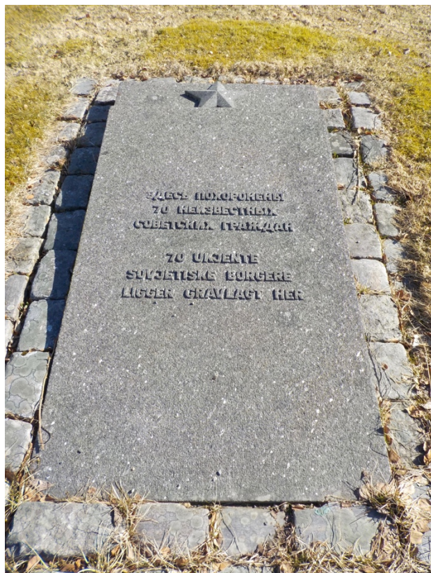
Bilde 4 og 5: Den sovjetiske krigsgraven på Lademoen.