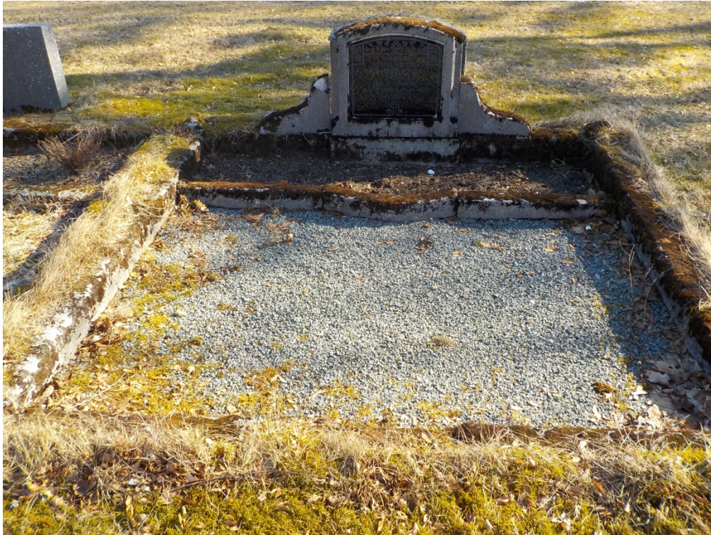
Bilde 8: En forfallen rammegrav med et nesten uleselig gravminne uttrykker alder og patina.