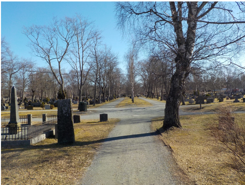
Bilde 2: Kirkegårdens tydelige akser og inndelingen i felt er fortsatt markert av alléene.