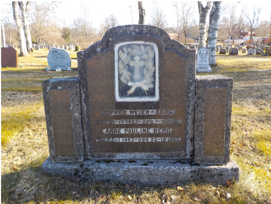
Bilde 13: Gravminne med sølvkrans og kors.