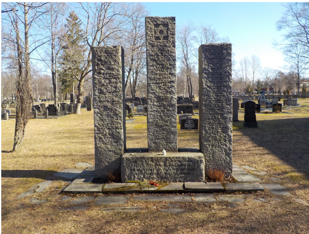
Bilde 7: Minnesmerke over henrettede jøder på den Mosaiske gravlunden, oppført i 1947.