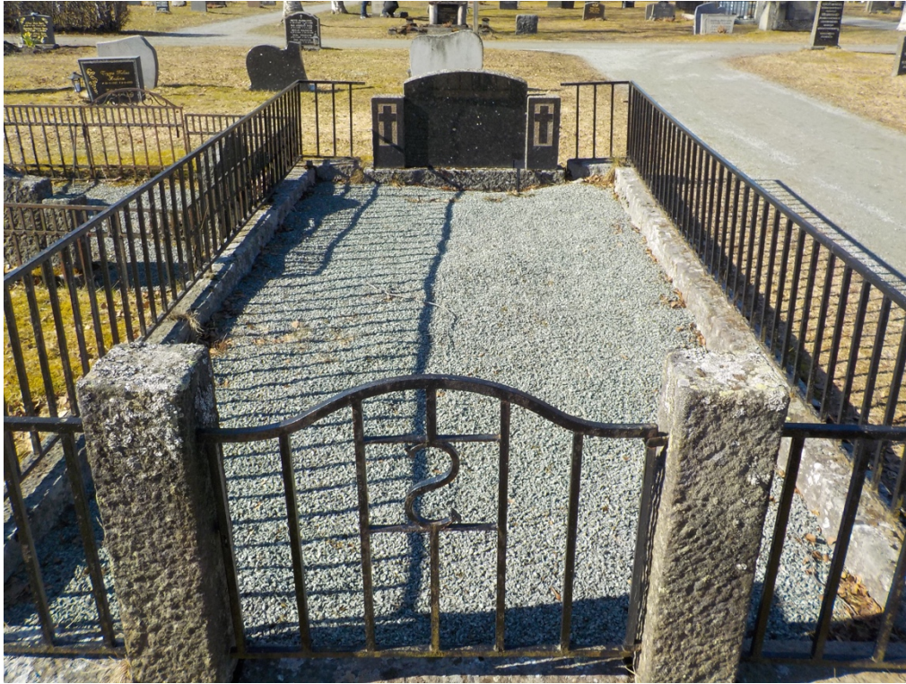
Bilde 10: Nedslipt gravminne.