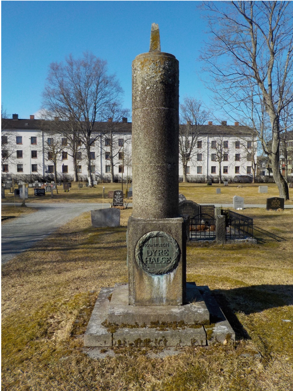
Bilde 14: Familiegravsted for grosserer Dyre Halse