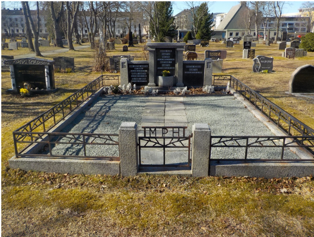
Bilde 9: Eldre familiegravsted som fortsatt er i bruk.