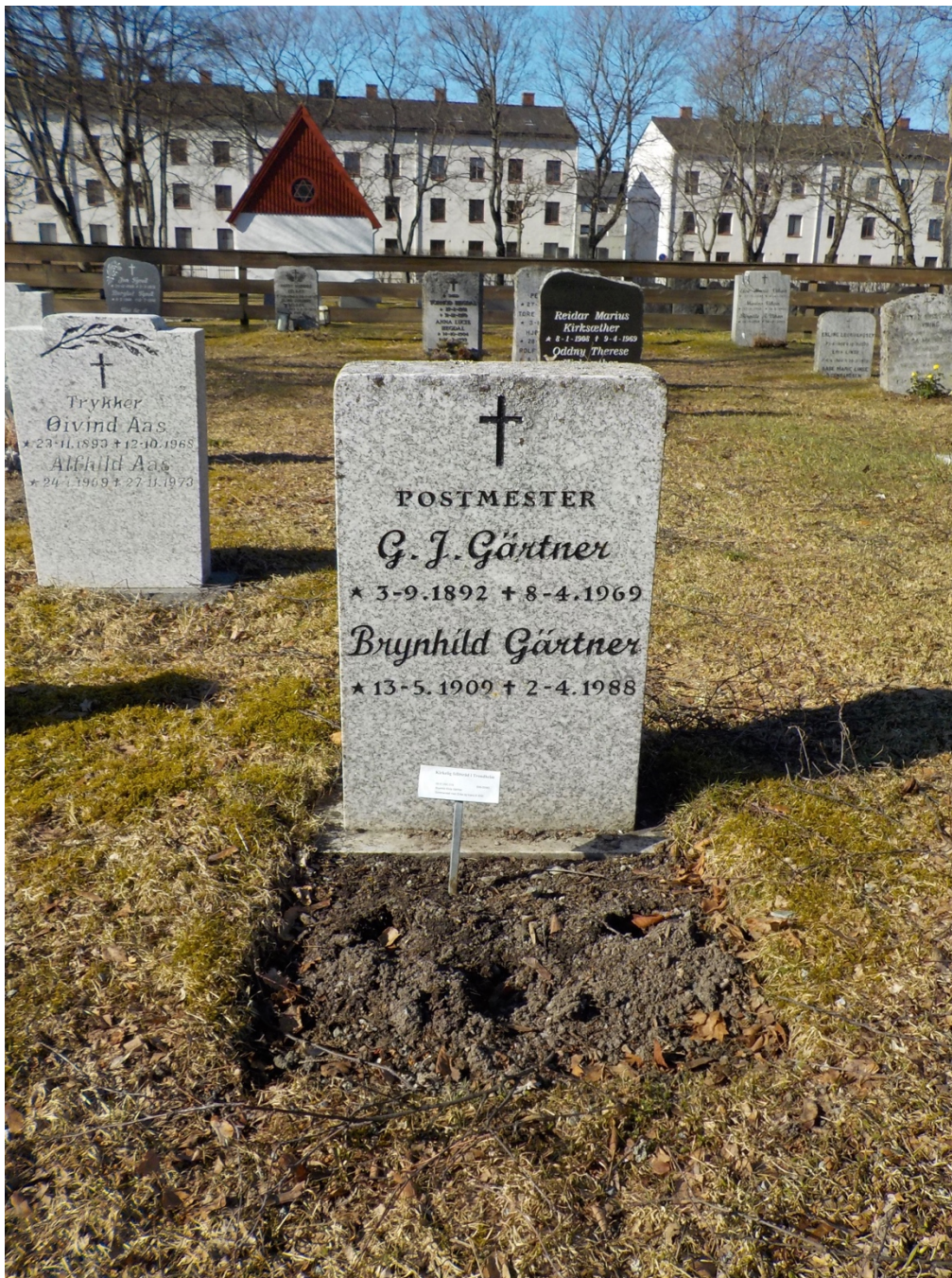
Bilde 15: Gravminne med yrkestittel: «Postmester». I bakgrunnen: «Trykker».