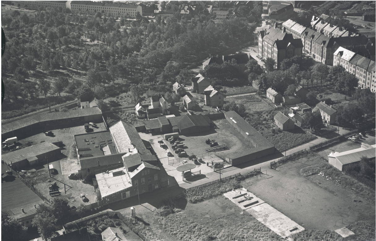
Bilde 1: Øverst i venstre hjørne ser man hvor tett beplantet Lademoen kirkegård var av trær på 1950-tallet.