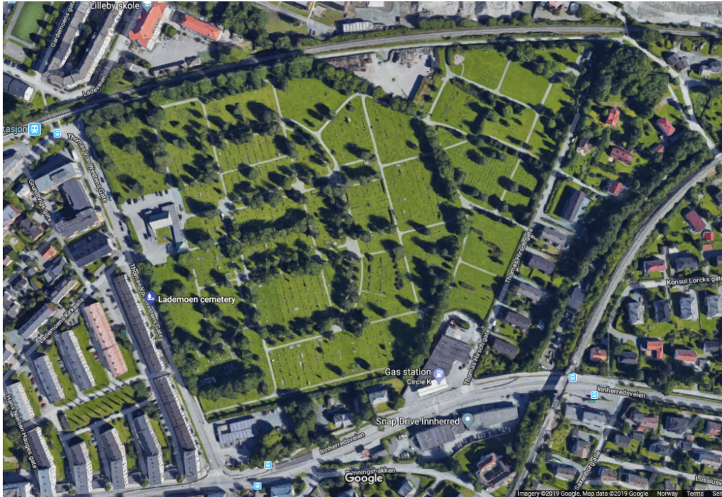
Bilde 3; Den nybarokke parkstrukturen er svært godt ivaretatt på Lademoen kirkegård.