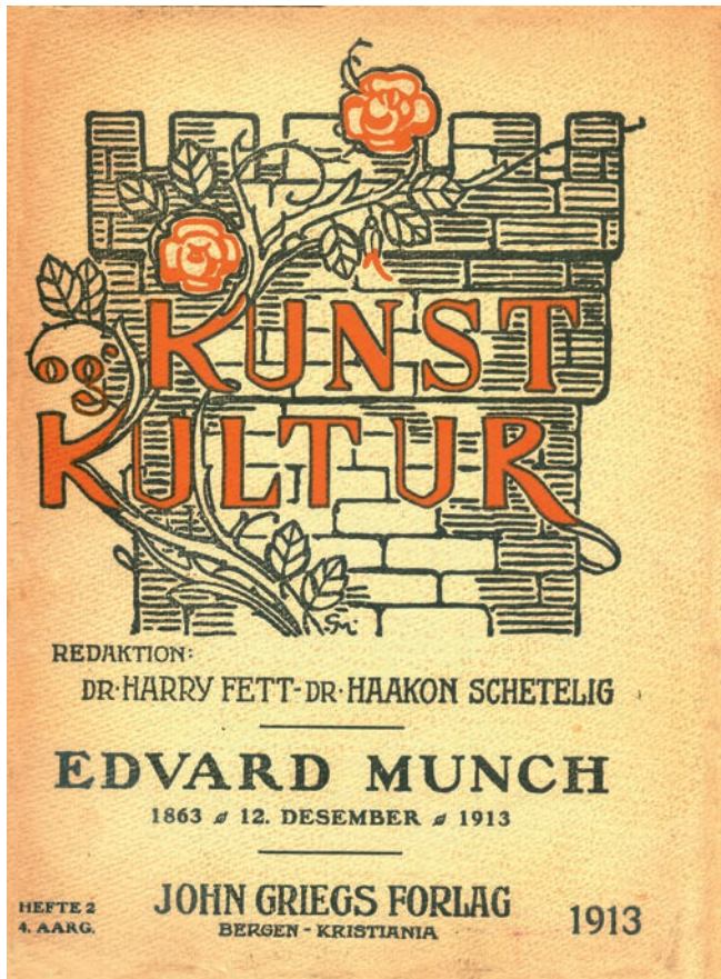
Ill. 2. Forsiden på heftet til Edvard Munchs 50-årsjubileum, 1913.

kunstnerens 50-årsdag: Med denne illustrerte publikasjonen hadde leserne fått i hende en litteratur skrevet på norsk, 9 og disse bidragene har fortsatt «verdi som historiske dokumenter» (s. 60). Videre stiller han seg kritisk til noen, men positiv til andre norske publikasjoner i mindre format. I et eget kapittel trekker han dessuten fram publiseringen av Munchs egne tekster i kataloger, brosjyrer og hefter etter århundreskiftet. Her gir artikkelforfatteren til kjenne vurderinger av tekstenes litterære kvaliteter, men antyder også en kritisk holdning til verdien av kunstnerens personlige utfall overfor det han forsto som et lite kvalifisert, norsk kritikerkorps.