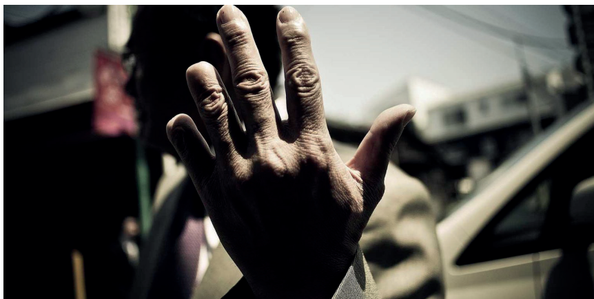
Paying the price (Kusters, 2018).

En fortelling om ulike strategier avhoppere fra yakuzaen anvender når de re-domestiserer ferdigheter og kunnskaper, samt mobiliserer kompetansen gjennom aktør-nettverk for å ta ett oppgjør med sitt tidligere liv.