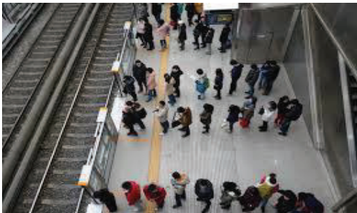
Figur 1 -The Japanese train/metro system (Smolyansky, 2016)

Dette gjør seg særlig gjeldende i noen aspekter av japaneres hverdag. Konseptet «meiwaku», eller å være til bry for andre, blir tidlig innlært gjennom skolesystemet (Dillon, 2007). Man går ikke over gata på rødt lys, du snakker ikke i telefon på bussen, du røyker ikke utenfor designerte områder og du unngår for