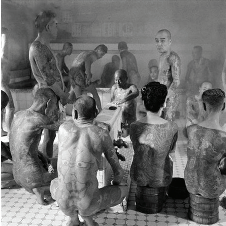
Figur 2 Yakuza Onsen (TheMindCircle, 2018)

Under intervjuene mine kommer det frem at det sosiale stigmaet er institusjonalisert. Være det seg i arbeidsmarked, hos myndigheter eller når det