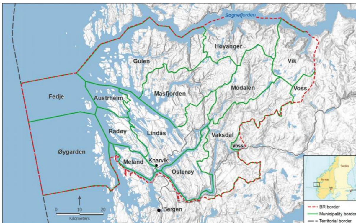
FIGUR 1: DETTE KARTET VISER DET PLANLAGTE NORDHORDALAND BIOSFÆREOMRÅDE OG KOMMUNENE SOM ER EN DEL AV OMRÅDET. HENTET FRA: NORDHORDALAND BIOSPHERE RESERVE – UNESCO APPLICATION AV KALAND, P.E. (RED), 2018.

I søknaden (2018) skrives det at Nordhordaland biosfæreområde vil ha flere kjerneområder og buffersoner, nærmere bestemt tre (se figur 2). Disse er kyst, fjord og fjell. Innenfor disse områdene blir økosystemene på Vestlandet, både på land, i ferskvann og i saltvann representert: