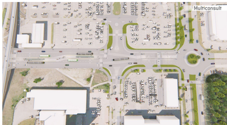
MIDTSTILT HOLDEPLASS: Slik ser Miljøpakken for seg at Sentervegen skal utformes.

Tiller er i dag kjent for å være et stort handelsområde med store parkeringsarealer og mye asfalt. Området er derfor bedre tilrettelagt for biltrafikken enn de gående. Likevel benytter mange barn og unge Sentervegen som sin daglige skoleveg. Både barneskoler, ungdomsskoler og videregående skoler ligger i nær tilknytning til Østre Rosten. Det ligger også i planene til kommunen at området skal få et løft og bli mer urbant. Det forventes derfor en økning av myke trafikanter i området og