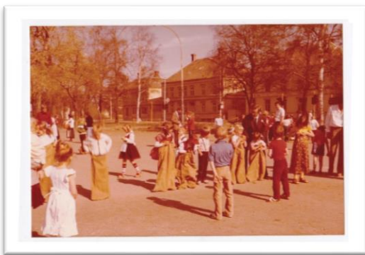
(Bilde 2: Ilaparken, 1978 )

Parken formes som et sted med sosiale, fysiske og materielle verdier. Parken representerer et sted som et naturmiljø, men også som et sted innenfor en geografisk avgrensning med menneskelig hverdagsliv og samhandling som står i relasjon til hverandre. Park er et sted for rekreasjon og en sosial arena. Sted blir også et sted for mening, identitet og tilhørighet avgrenset innenfor et geografisk område som folk knytter tilhørighet til (Lier & Stokke, 2017, s. 49-50).