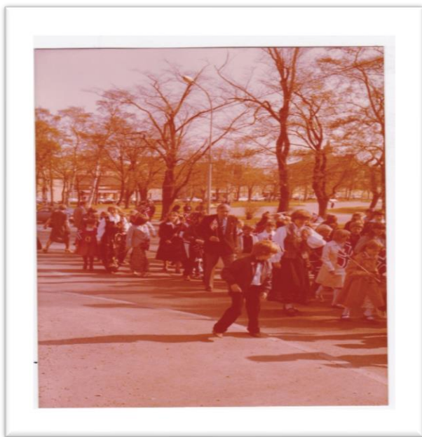
Bilde 4: Ilaparken slutten av 1970-tallet

Et annet aspekt ved parken er å peke på identitet og stedtilknytting. Noe ikke nødvendigvis et planideal tar høyde for i en byutvikling er hvordan folk relateres til et sted eller hvilke assosiasjoner som er bundet til det stedet ut fra identitet og tradisjoner. Her har et par av informantene åpnet nye syn som ikke samsvarer med modellen. For eksempel hvor informanten har presisert at Ilaparken knyttes som nærparken, og reflekterer og deler minner om barndommen i Ilaparken. Som dette bildet viser et eksempel på.