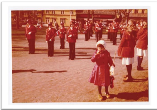
(Bilde 3: Ilaparken, 17.mai, 1978)

I dag ser vi et sted for rekreasjon og spennende belyningsprosjekt som fremstiller Trondheims eldste park i et nytt lys. På dagtid er parken en oase i bydelen Ila som gir parken flere funksjoner. Folk finner seg til rette i parken som både byr på fotballbane, lekeplass, paviljong og fontene samt hekker og blomster som utgjør en labyrint (Otra Norge, 2014). Trondheim kommune jobber mye med universell utforming, og at det derfor var nærliggende for dem å tenke i disse baner også når det gjaldt belysning av et offentlig uterom som Ilaparken (Otra Norge, 2014).