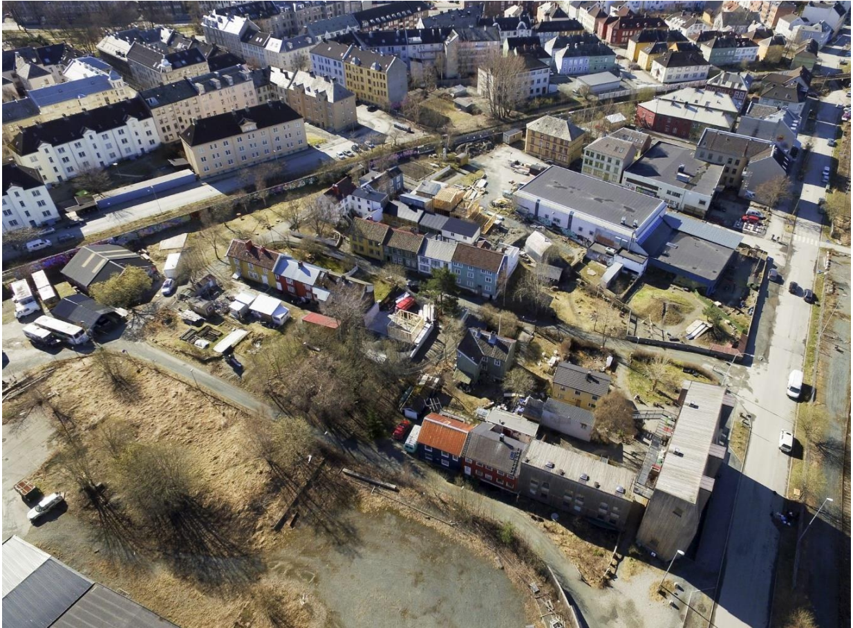
Svartlamon sett ovenfra, hvor innrammingen tydeliggjøres med Strandveien til høyre, Nordtvedts gate i forgrunnen, og jernbanelinja som skiller Lademoens murgårder fra bydelen. Foto gjengitt med tillatelse.